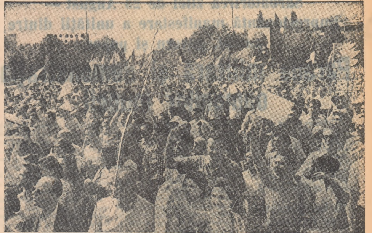
Oamenii muncii din Capitală își manifestă dragostea și atașamentul față de partid și guvern

În fruntea coloanei muncitorilor pășește un grup imens ce poartă steaguri. Dese ca spicelile în lan, steagurile flutură lin în aerul nemișcat al zilei fierbinte de august. După stegarii urmează un car alegoric care prezintă plastic producția întreprinderii și a celorlalte fabrici din raionul 23 August. Vagoane de marfă, linii de ci-met și alte produse cu marca fabricii „23 August” pot fi găsite as-