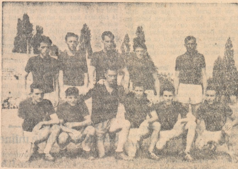
Echipa de handbal a muncitorilor agricoli și țăranilor muncitori din comuna Lovrin, regiunea Timișoara

La 30 iunie a. c. numărul depunătorilor la casele de economii din întreaga țară s-a ridicat la 2.584.000. Sumele economisite de depunători pe libere de economii și obligațiuni C.E.C. sînt astăzi de 15 ori mai mari decît în 1948. Un mare număr de depunători sînt oameni ai muncii din agricultură.