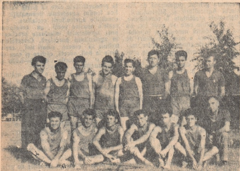
Echipa de oină a țăranilor muncitori din comuna Băduleasa, raionul Turnu Măgurele, campioană a Spartachiadei

cutind felurite exerciții de gimnastică. Sportivii clubului „Rapid” au înscris cu trururile lor inițialele patriei noastre scumpe. Dinamoviștii au format din mers o minunată piramidă. Forța și îndemnearea lor stîrnește nesfîrșite ropote de aplauze.