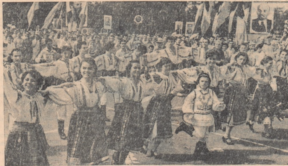
Cu cîntecul și jocul, trec fete și băieți