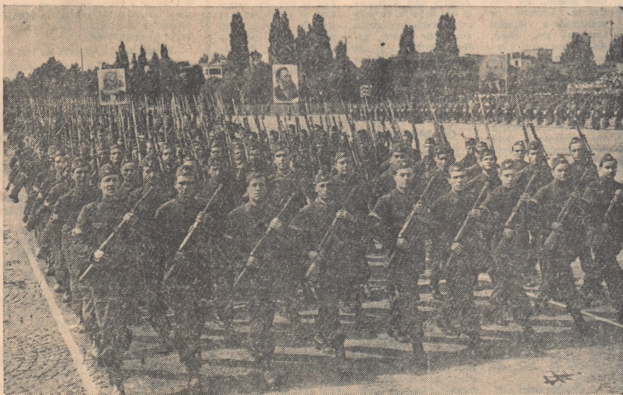
În pas cadențat trec gărzile muncitorești

Carele de luptă — adevărați coloși de oțel, cetății umbrațoare — încheie parada militară.