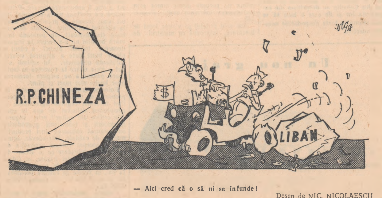
— Aici cred că o să ni se infunde! —

În urma efectuării analizelor se întocmește harta agromchimică a teritoriului cercetat indicîndu-se cantitatea de elemente găsite în sol și se dau indicații dacă solul este slab, moderat sau bine aprovizionat. Această hartă avînd indicată pe fiecare parcelă cantitatea de îngrășămintă care urmează a fi încorporată în sol, este înmînată de către pedolog raional proprietarului. Acesta mai primește totodată indicații cu privire la urgența aplicării diferitelor