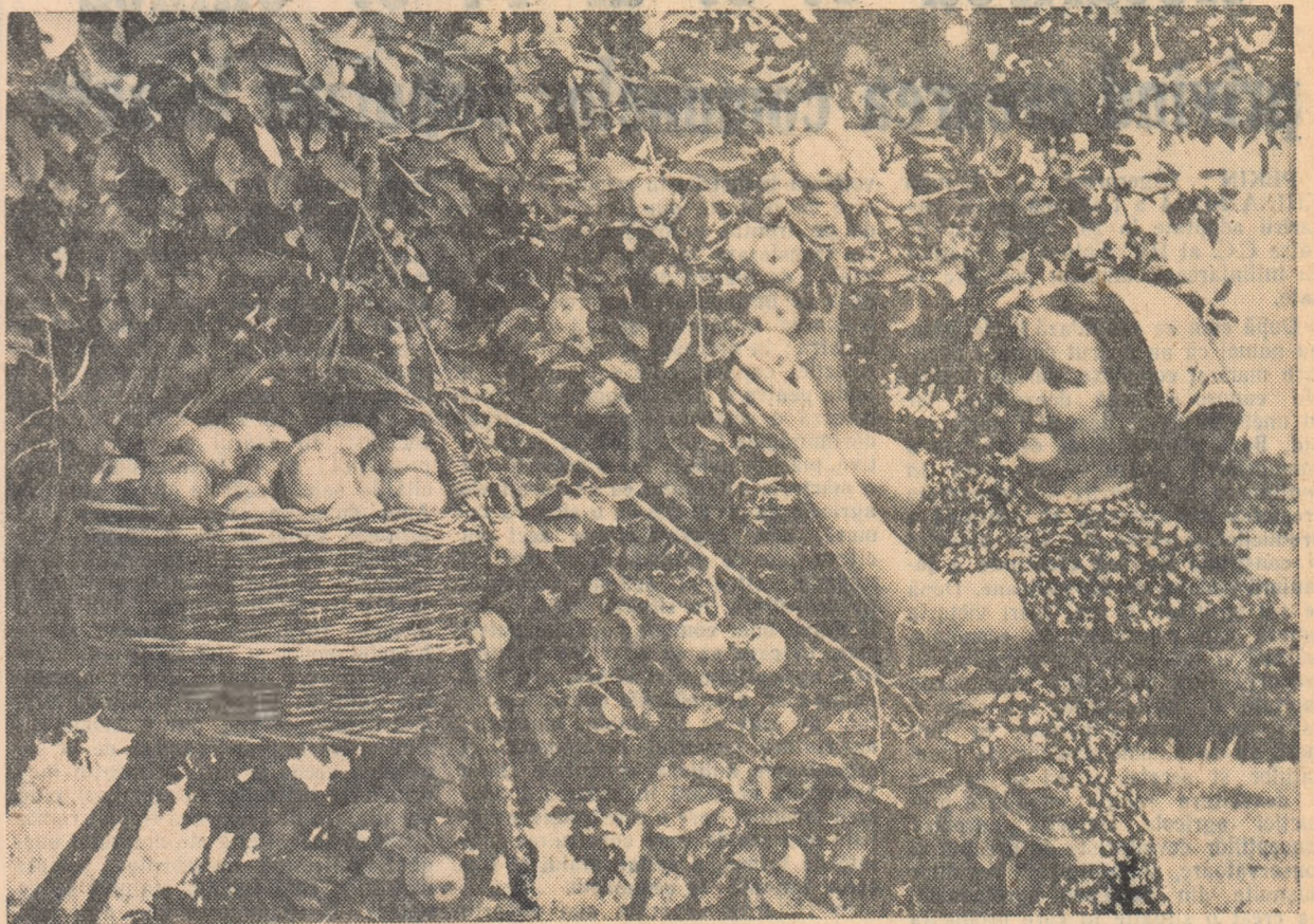
Livada de meri a gospodăriei de stat Mogoșoaia, bine întreținută, va da în anul acesta o mare producție. În fotografie: muncitoarea Anton Rădița, una din muncitoarele frumtașe ale gospodăriei culege mere pentru a le trimite magazinelor gostat.