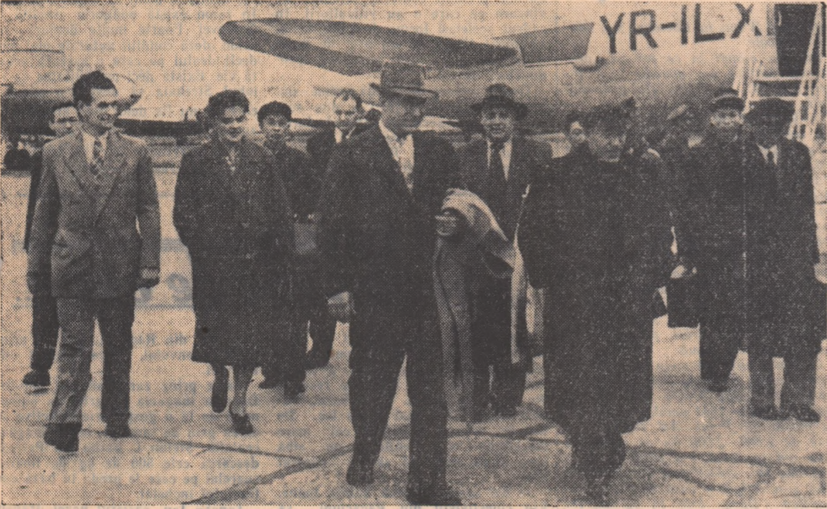
Sosirea delegațiilor U.R.S.S. și R.P. Chineză pe aeroportul Băneasa

Săptămîna aceasta, la 16 octombrie, vor începe la București lucrările celei de a II-a Conferințe Mondiale a muncitorilor agricoli și forestieri.