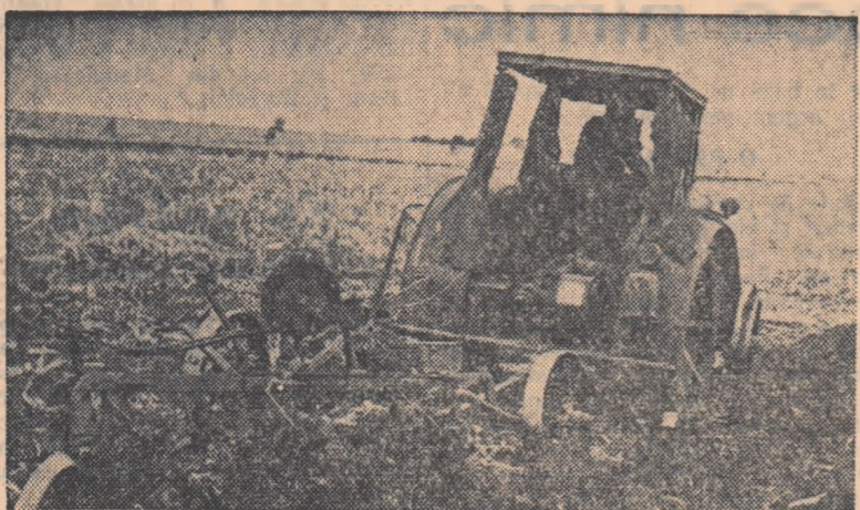
Pe terenurile eliberate de culturi de toamnă ale gospodăriei colective „Vială Nouă” din comuna Sintana, regiunea Oradea, au intrat din nou tractoarele.