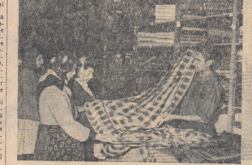
Colectiviștii din Vinga, regiunea Timișoara sint cumpărători de nădejde. Magazinele cooperative trebuie aprovizionate aproape zilnic.

La Institutele agronomice din București, Iași, Cluj și Craiova, se primesc inserții în cursul fără frecvență. Depunerea actelor în vederea concursului de admitere are loc între 25 octombrie și 15 noiembrie a.c. Examenul de admitere începe în ziua de 20 noiembrie a.c., orele 9 dimineață. Anul I de studii în învățămîntul țăr. frecvență și seral se deschide la 1 decembrie 1958.