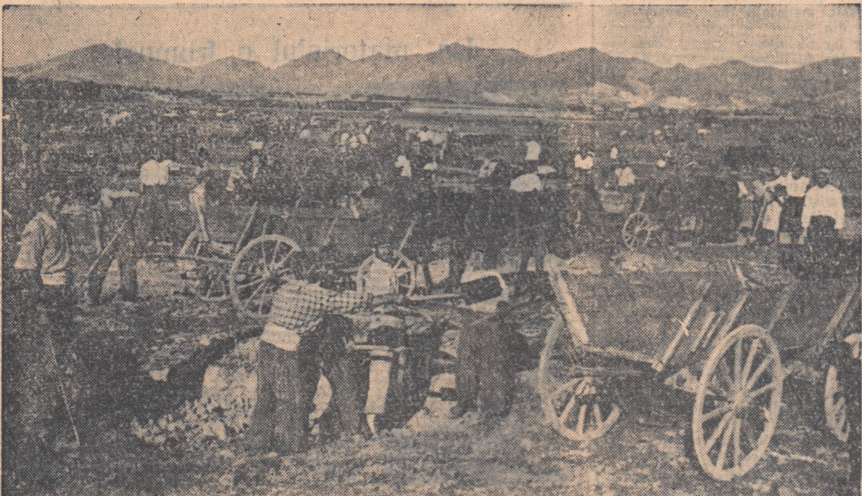
Furnicar de oameni și atelaje. Aci, prin munca voluntară a țărănilor muncitori din comuna Jijilia, raionul Măcin, regiunea Galați, vor fi redat agriculturii 2.400 ha. teren arabil.