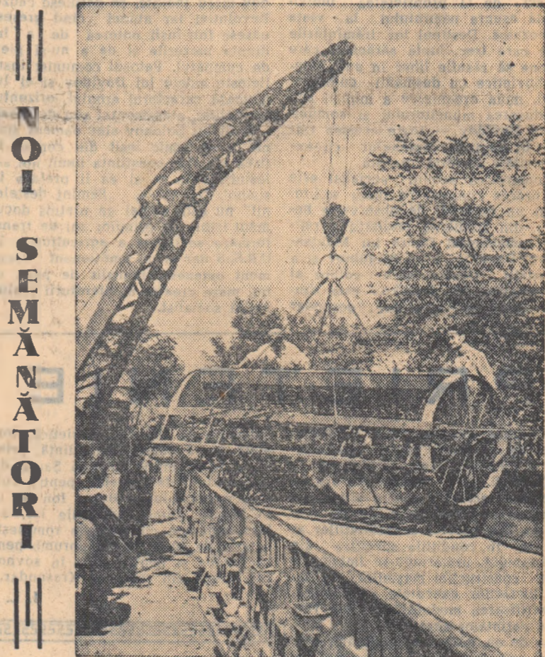
De curind, sectorul de mașini agricole al uzinelor „Vasile Roaită” din Capitală, a realizat semănătoarea de cereale cu 30 de rînduri. În fotografie: încărcarea în vagoane a unui lot din noile semănătoare pentru a fi trimise agriculturii.

După miting a fost vizitat noul carier de locuințe construite pentru muncitorii oțelari din Kladno.