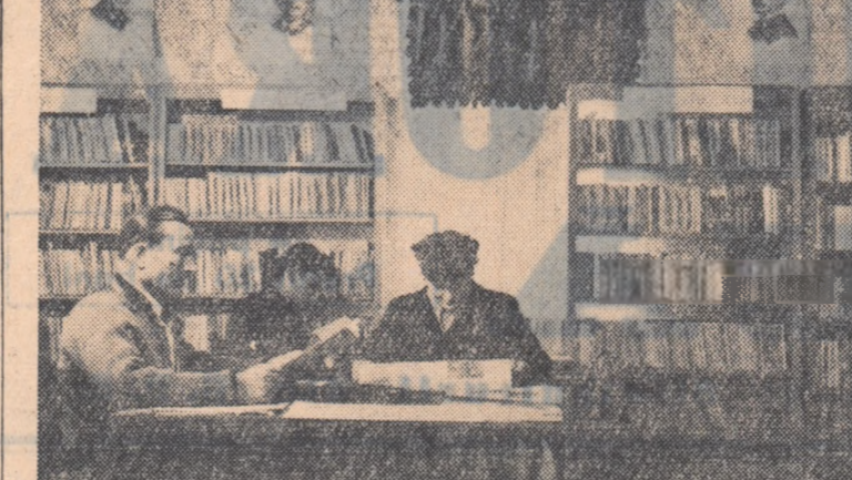
O carte, o broșură, o revistă ilustrată, găsecă totdeauna cititorii pasionați. La biblioteca comună din Basarabi, regiunea Constanța, numărul cititorilor crește în fiecare lună.