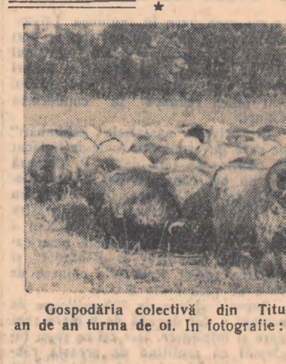
Gospodăria colectivă din Titu-Tirg, regiunea București, și-a mărit an de an turma de oi. În fotografie: o parte din turma de oi la păscut.