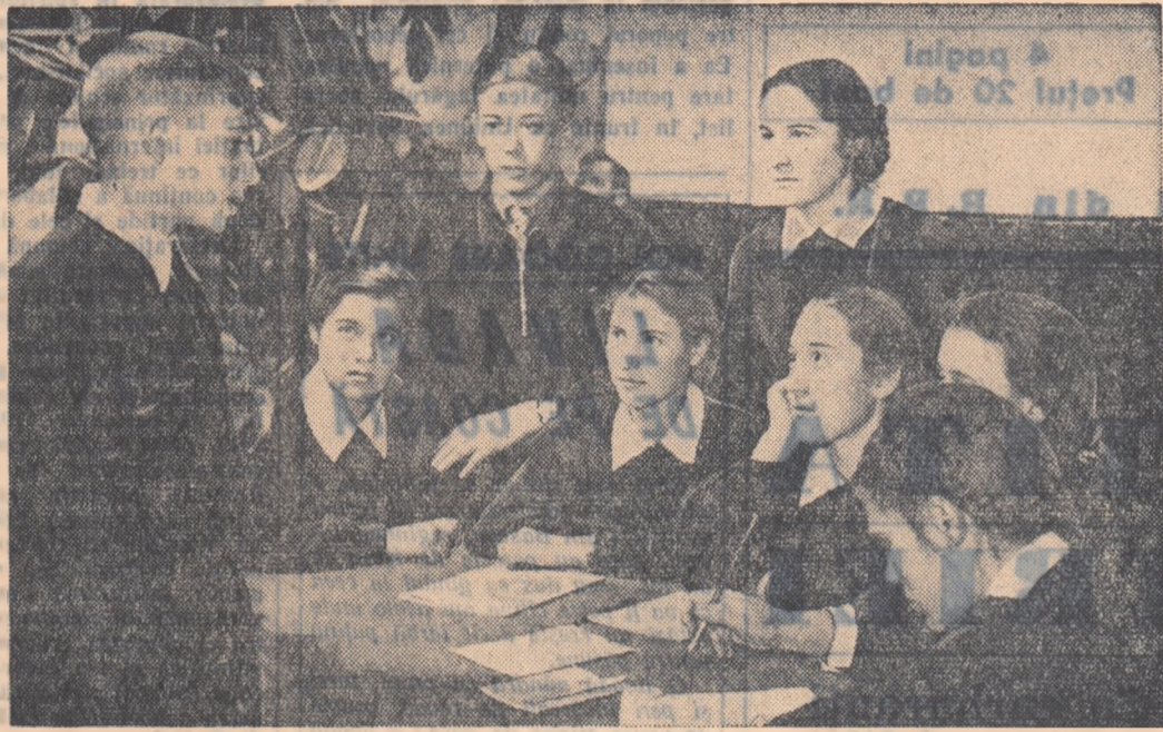
Nu se poate să nu fiid adinc emoționat în aceste clipe cînd tovarășii tăi te-au chemat pentru a vedea dacă ești pregătît să faci parte din gloriosul Comsomol leninist.

În cadrul Săptămîinii agrotehnicii sovietice, în regiune au fost organizate simpoziioane cu teme privind dezvoltarea agriculturii sovietice, expunerii ale oamenilor muncii care au vizitat în acest an Expoziția Agricolă Unională de la Moscova, standuri de cărți agrotehnice sovietice etc. În gospodăriile agricole colective și întovărășiri agricole au loc schimburi de experiență în cadrul cărora sînt popularizate succesele și metodele înaltate de muncă ale colhoznicilor sovietici.