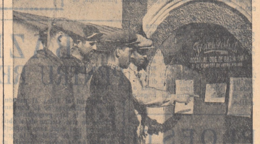
Fiecare număr nou al gazetei de perete de la S.M.T.-Titu este citit și discutat cu apîndere. Fapte demne de laudă, rezultate ale întrecerii, cite o caricatură care pune „Punctul pe I”, așa se prezintă fiecare ediție a „Tractoristului”.

Membrii gospodăriei agricole colective din comuna Ernei, raionul Tg. Mureș, au obținut o recoltă medie de 13.930 kg de struguri la ha, iar cei din Nicoleşti-Ciba au obținut în medie 10.000 kg de struguri la ha.