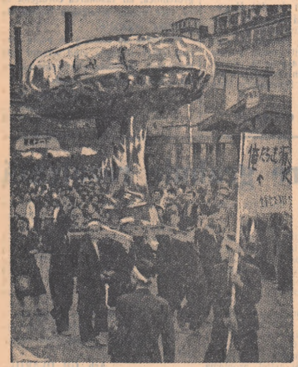
Un miting de protest în Japonia împotriva experiențelor cu armele nucleare.