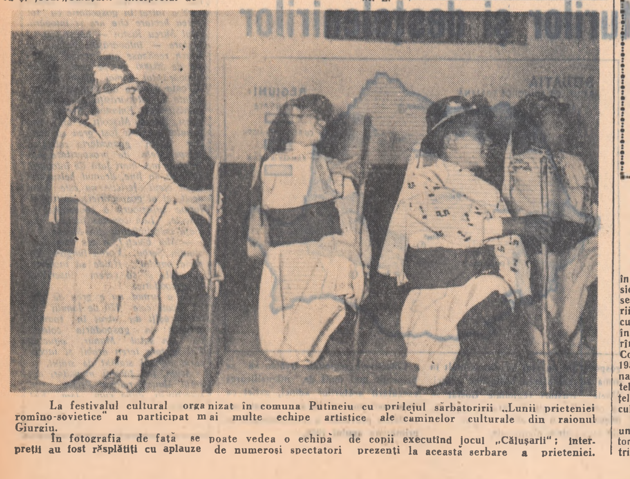
La festivalul cultural organizat în comuna Putineiu cu prilejul sărbătoririi „Lunii prieteniei romino-sovietice” au participat mai multe echipe artistice ale căminelor culturale din raionul Giurgiu.

De aceea în cartea sa intitulată „Pe nerăsuflăte”, Ilya Ehrenburg ne-a dăruit mai mult decît un roman: ne-a dăruit un îndrumar în viață.