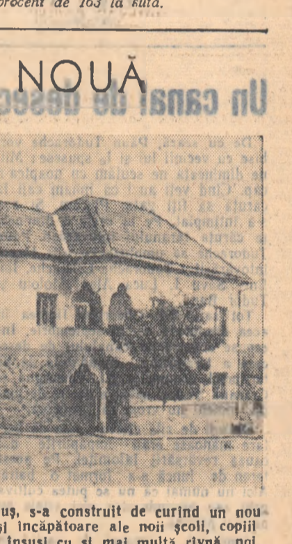
În comuna Coplina, raionul Bălți, s-a construit de curind un nou local de școală. În sălile luminoase și încălzite ale noii școli, copiii țăranilor muncitori din comună își vor însuși cu și mai multă râvnă, noi și noi cunoștințe.