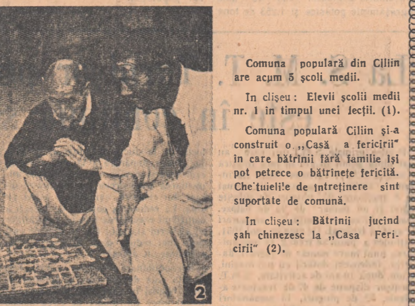
Comuna populară din Cilin are acum 5 școli medii. În clișeu: Elevii școlii medii nr. 1 în timpul unei lecții. (1). Comuna populară Cilin și-a construit o „Casă a fericiții” în care bătrînii fără familie își pot petrece o bătrînetă fericită. Che-tuțiile de întreținere sînt suportate de comină. În clișeu: Bătrînii jucînd șah chinezesc la „Casa Fericii” (2).