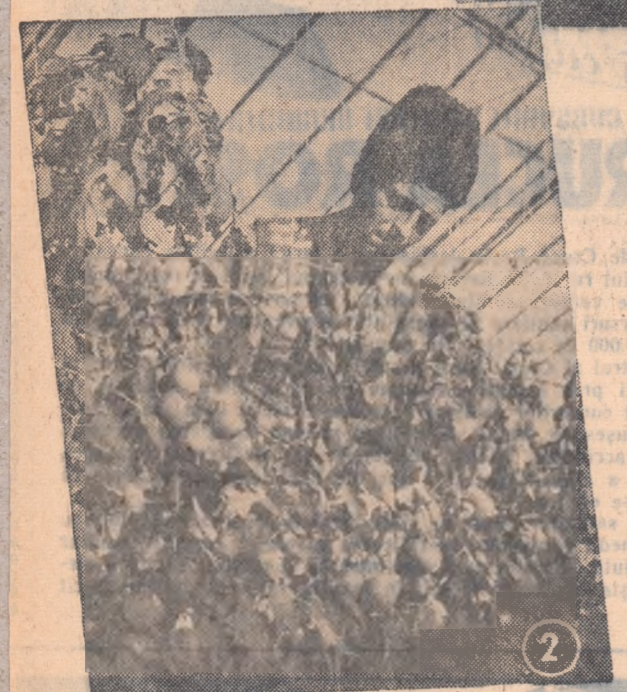
Gospodăria agricolă colectivă „11 Iunie” din comuna Hălchiu, regiunea Stalin, se numără printre gospodăriile frunțașe pe țară. Vă prezentăm în fotografiile alăturate citeva imagini din viața și munca colectiviștilor din Hălchiu.