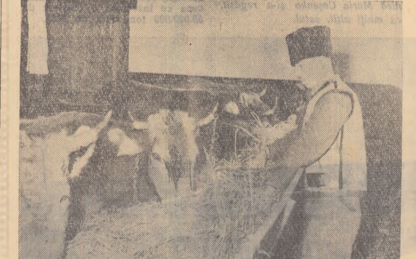
Colectivitățile din comuna Horia, regiunea Bacău, acordă o atenție deosebită buneii furajării a animalelor pe timpul iernii. Iată-l în fotografie pe brigadierul zootehnic Păduraru C-tin aducînd fin proaspăt junincilor.