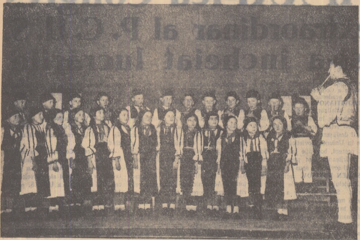
La poalele munților Carpați, pe riuul Luncavăi, se află comuna Vădeeni. Tradiția localnicilor de a păstra comorile culturale ale folclorului românesc se vede prin înșiră activitatea dădă de aceștia în cadrul căminului cultural.

În fotografie: Echipa de fluterași pregătind un spectacol.