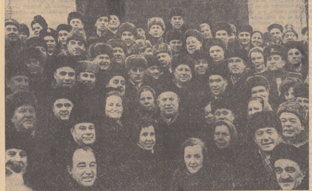
În incinta Kremlinului: N. S. Hrușciov, prim-secretar al C.C. al P.C.U.S., A. I. Mikoiian și A. I. Kirilenko membri ai Prezidiului C.C. al P.C.U.S. printre delegații la Congres.