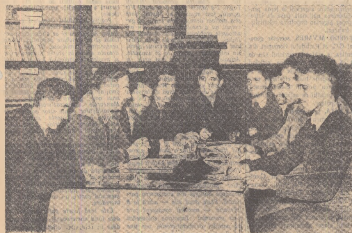
Fotoreporterul nostru a surprins un aspect din ședința consiliului de conducere al gospodăriei colective „Viața Nouă” din comuna Romineni, raionul Ploiești, în care s-a discutat planul de producție pe 1959. În plan se prevede, între altele, ca în acest an să se cultive sticla de zahăr pe 10 hectare și floarea-soarelui pe 18 hectare.