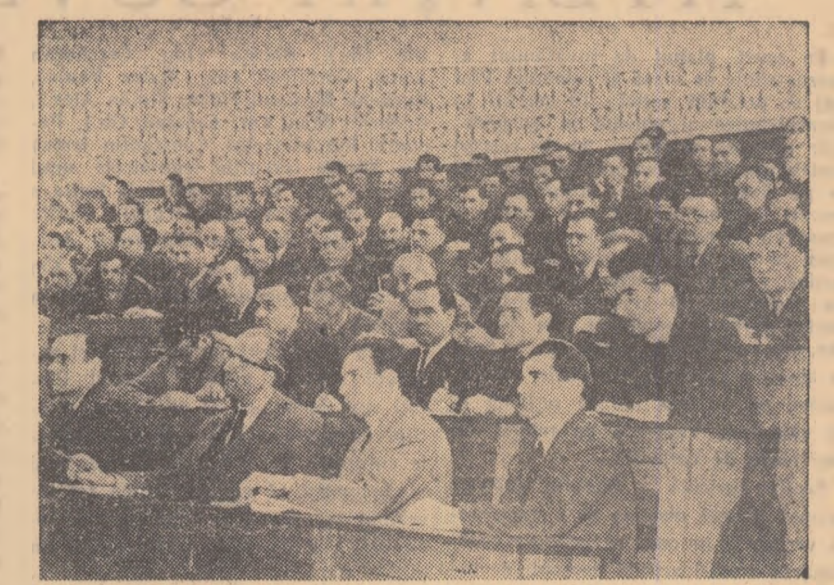
Aspect din sală

De pe cîte două ha G.A.S.-urile Chirnoși și Urziceni s-au angajat să obțină producții record de 20.000 kg. orez la hectar.