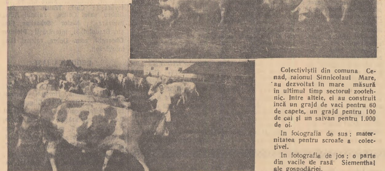
Colectiviștii din comuna Cenad, raionul Sînnicolau Mare, au dezvoltat în mare măsură în ultimul timp sectorul zootehnic. Între altele, ei au construit încă un grajd de vaci pentru 60 de capete, un grajd pentru 100 de cai și un saivan pentru 1.000 de oi. În fotografia de sus: maternitatea pentru scroafe a colectivelor. În fotografia de jos: o parte din vacile de rasă Siemenshal ale gospodăriei.