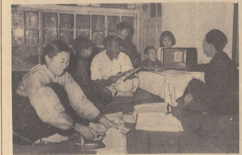
În satele din Republica Populară Democrată Coreeană se desfășoară mari lucrări de electricificare. Această acțiune este sprijinită de muncitorii din industrie și de studenți. La sate se construiesc numeroase uzine hidroelectrice mici. În fotografie: un aspect din casa unui membru al cooperativei agricole din Pungok (Phenianul de Sud), care se bucură din plin de binefacerile electricității.

În prezent, potrivit planului unic al cooperativei unice (nu de mult cooperativele mici s-au comasat în cooperative mari), se fac mari construcții cu caracter cultural la Iuden. Cooperatorii din acest sat pășesc cu hotărîre spre un viitor fericit.