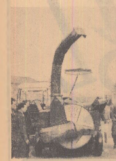
Mulțime de oameni admiră această mașină de recoltat și pregătite nutrețuri pentru siloz, și altele expuse la expoziție.

În fiecare orașel întîlnim susede de uzine și fabrici pe ale căror coșuri se nalță spre cer un fum negru și gros de cărbune. Peste tot se află construcții noi cu 5-6 etaje. În satele complet electificate, se observă