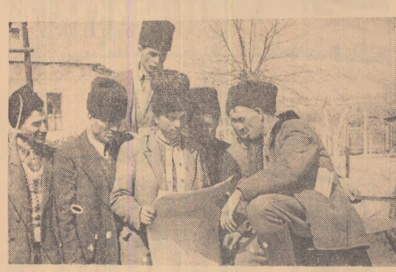
Decretul Prezidiului Marii Adunări Naționale privind lichidarea rămășițelor oricăror forme de exploatare a omului de către om în agricultură. În scopul ridicării continue a nivelului de trai, material și cultural al țărănimii muncitoare și dezvoltării construcției socialiste a fost primit cu deosebit interes în satele patriei noastre. În fotografie: un grup de țărani muncitori din comuna Pogonele, regiunea Ploști, citind Decretul.