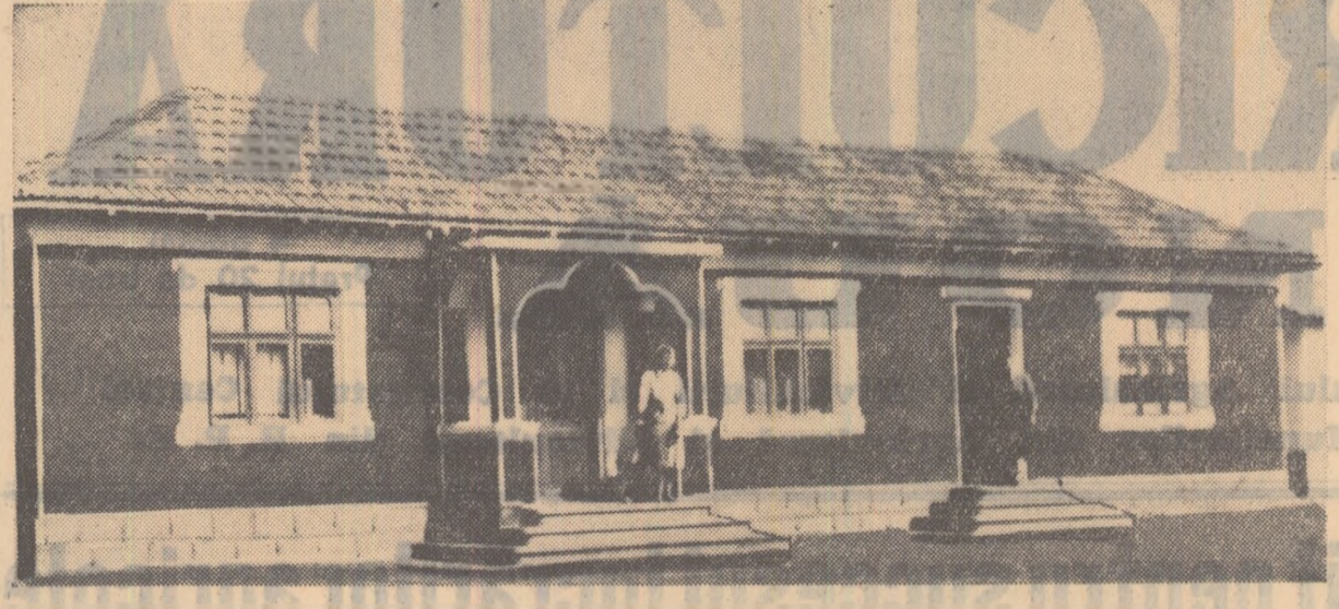
Venturile mari realizate de pe urma muncii în comun, a dat posibilitatea la mulți colectivști din comuna Cuza Vodă, raionul Medgidia, să construiască case noi. În ultimii ani ei au ridicat peste 100 de noi case, frumoase, durabile și sănătoase. În fotografie: casa nouă a colectivistului Petre Cristian.