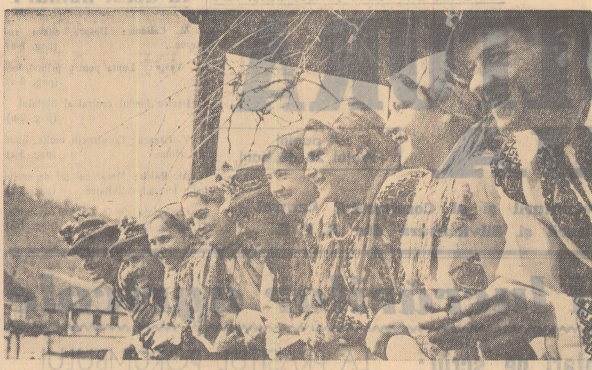
Comuna Lueriu, Regiunea Autonomă Maghiară, este complet cooperativizată. Acest lucru a deschis largi posibilități nu numai pentru practicarea unei agriculturi noi, bazate pe cuceririle științei agrozootehnice, dar și dezvoltării activității culturale. În fotografie: un grup de tineri și tinere care fac parte dintr-o formație artistică a căminului cultural îmbrăcați în pitorești lor costume naționale.