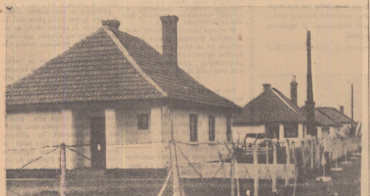
Mecanizatorilor de la S.M.T. Cobadin, regiunea Constanța, le sînt create condiții tot mai bune de muncă și de trai, iată, în fotografie, o parte a locuințelor individuale construite de curînd pentru mecanizatorii din acest S.M.T.