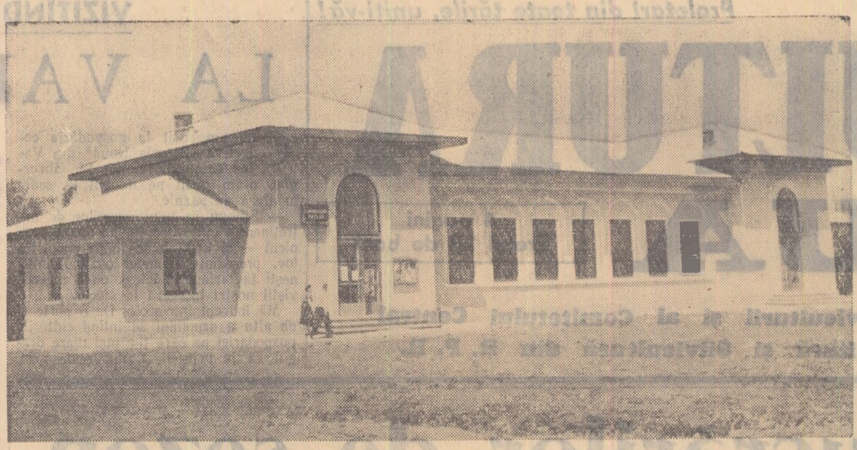
Vrednicii locuitori ai comunei Dala, în regiunea București au construit de curind, prin contribuțiile bănească și muncă voluntară, căminul cultural pe care-l vedeți în fotografie. Căminul cultural are, între altele, și o frumoasă sală de cinema.

La sfârșitul acestei săptămâni vor avea loc, în diferite comune și sate, noi manifestări culturale și serbări populare închinată „Zilelor culturii și artei R.S.S. Bielorusie”.