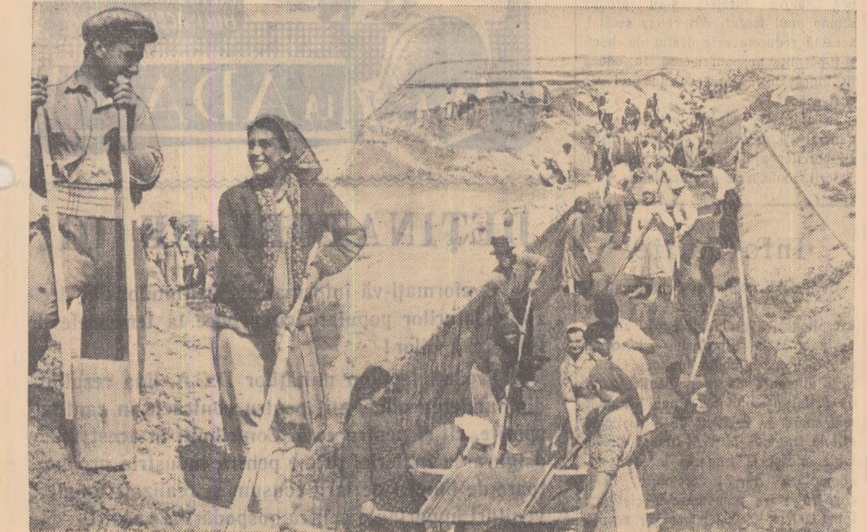
La chemarea partidului, sute de mii de țărani muncitori din satele patriei noastre au pornit să lucreze voluntar pentru a reda agriculturii suprafețe de terenuri neproductive sau slab productive. În fotografie: colectivitatea din Cegani, regiunea Constanța, muncesc pe un șantier de hidroameliorații.