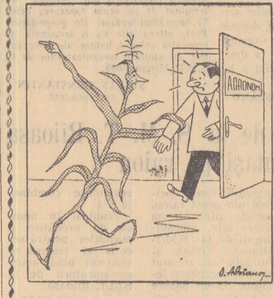
Porumbul: E timpul să vezi cum trăim!