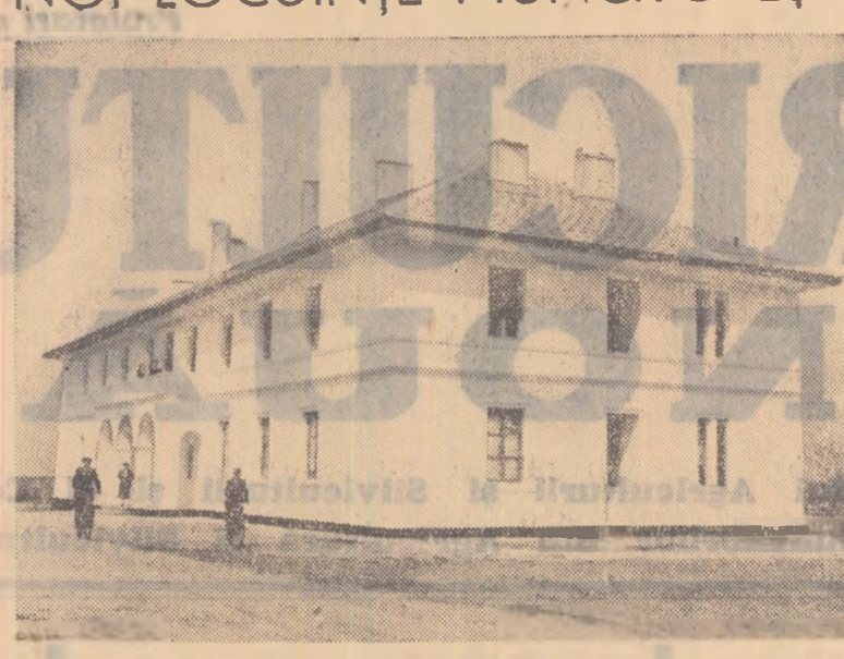
Asigurarea unor condiții de trai cit mai bune constituie o preocupare de seamă a conducerii S.M.T. Coladin, regiunea Constanța. De curînd a fost dat în folosință un nou bloc pentru muncitorii și tehnicienii stațiunii.