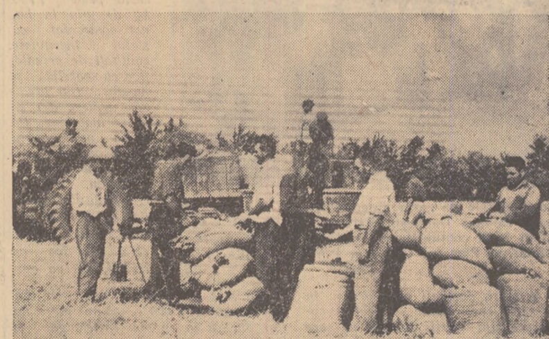
Se strînge recolta de grîu de pe țarlăua Turtumanu a gospodăriei colective din satul Cuza Vodă, raionul Medgidia. Producția la hectar: 1.500 de kg.