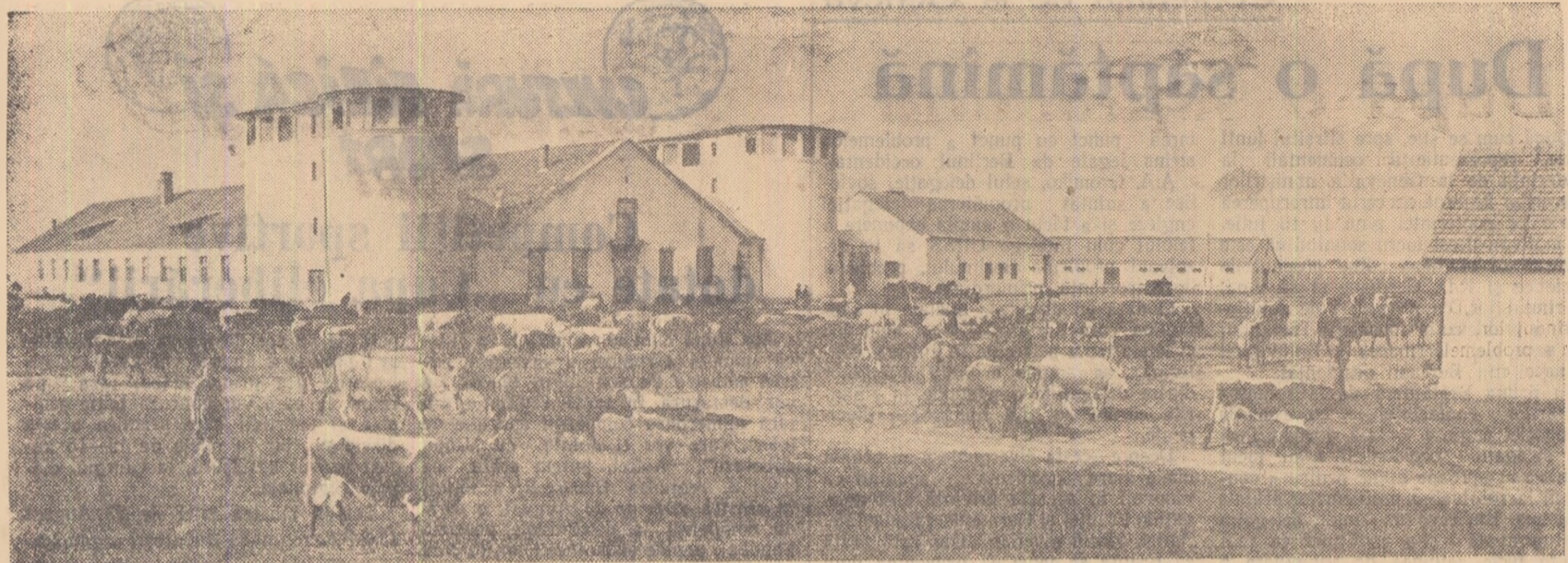
Pentru sporirea cointeresării colectivizatorilor din Codlea