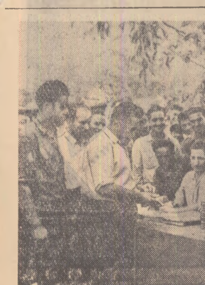
Preocuparea colectivizatorilor pentru dezvoltarea multilaterală a gospodăriei lor este răsplătită, împărțirea celui de al treilea avans bănesc pe anul acesta este o dovadă grăitoare.

În ziua de 15 iulie membrii întovărășirii agricole „Petofi Sandor” din comuna Tîrnam, raionul Carei, au terminat treierul celor 48 de ha grâu de toamnă, obținînd în medie 2.150 kg la hectar.