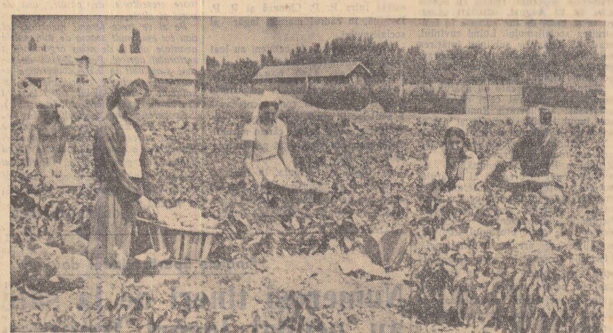
Membrul gospodăriei agricole colective Mircea-Vodă — regiunea București — au muncit cu rîvnă în acest an pentru a obține recolte frumoase și în sectorul legumicol. În fotografie: un aspect de la recoltatul ardelor grași