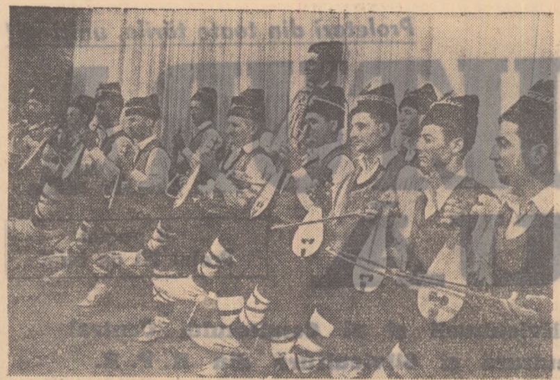
Echipa de fotbaluri a căminului cultural Lunca de Jos-Cluj, regiunea Constanța, în timpul unui spectacol.