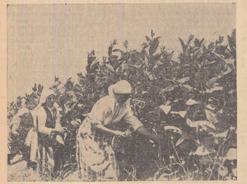
Stringerea tufunului în cooperativa agricolă din satul Petov, raionul Fier.