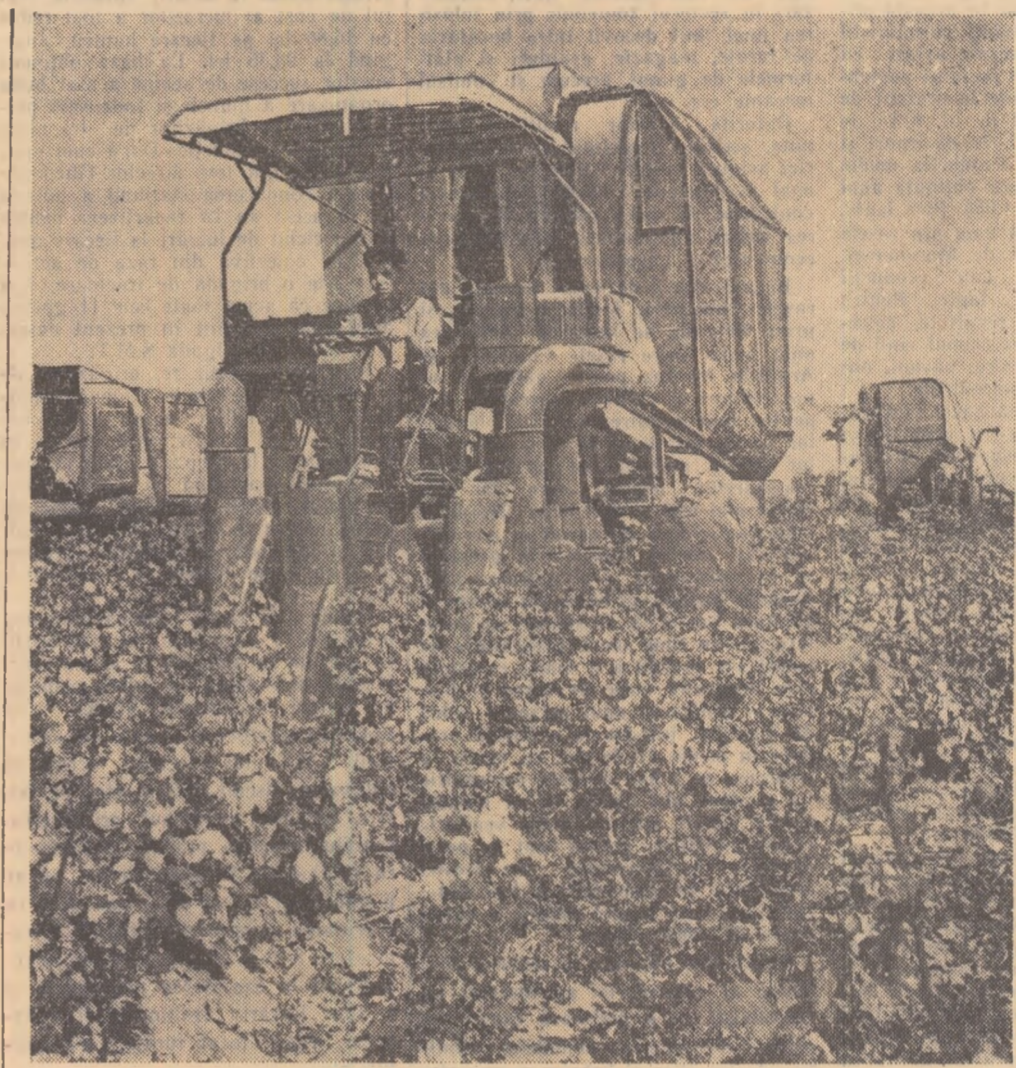
Din tehnica agriculturii colhoznice

● IN TINUTUL Krasnoiarisk din Siberia, pe malul pitoresc al lacului Kizil-Kul, s-a deschis o casă de odihnă construită de colhozurile din raionul Minusinsk. Primele grupuri de colhoznici și-au și petrecut aici concediul.