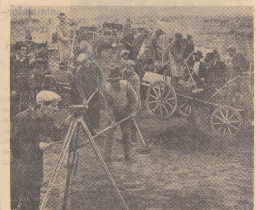
Sute de colectiviști și întovărășiți din satele raionului Călărași lucrează cu însușirea pe șantierul de irigații Roseji-Dichiseni.