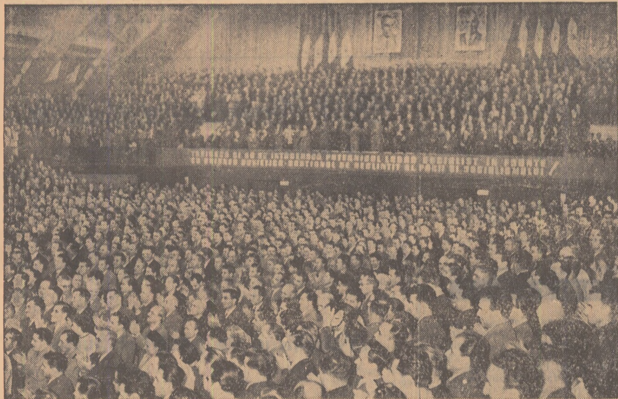
O parte din participanții la mitingul din sala Floresca

Poporul nostru a sărbătorit cu înalta și entuziasm împlinirea a 42 de ani de la victoria Marii Revoluții Socialiste din Octombrie. În marile întreprinderi din orașele țării, în unitățile agricole socialiste, la sate, au avut loc mitinguri și adunări festive consacrate marii sărbători. Oamenii muncii au manifestat cu acest prilej pentru puterea Uniunii Sovietice și gloriului său Partid Comunist, pentru Partidul Muncitoresc Român, pentru prietenia de nezdruccinat dintre poporul nostru și popoarele U.R.S.S., pentru pace în lumea întreagă.