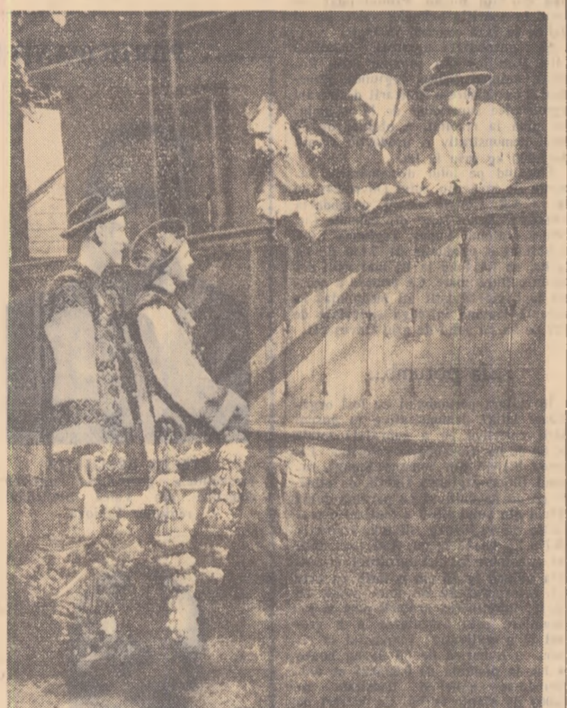
În anii regimului democrat-popular, și obiceiurile și tradițiile frumoase ale poporului capătă o înflorire deosebită. Priviți în fotografie pe acești doi tineri din comuna Rușii Muni, Regiunea Autonomă Maghiară, îmbrăcați în frumoase straie ardelenști, făcînd tradiționala învățare la muncă.

Pe urmele materialelor publicate MAI MULTĂ GRIJA PENTRU ASIGURAREA RECOLTEI ANULUI VIITOR