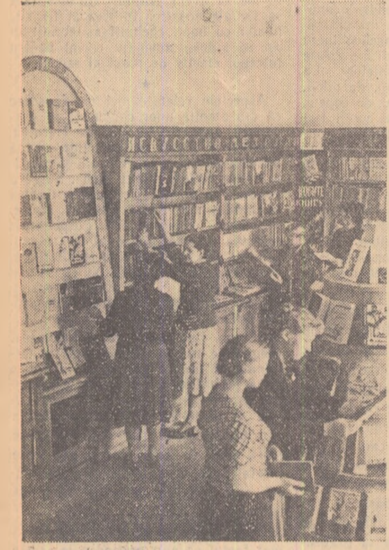
In stanița Staro-Minskina din ținutul Krasnodar s-a deschis anul acesta o librărie cu auto-deservire. Aici cumpărătorii își aleg singuri cărțile din rafturi.