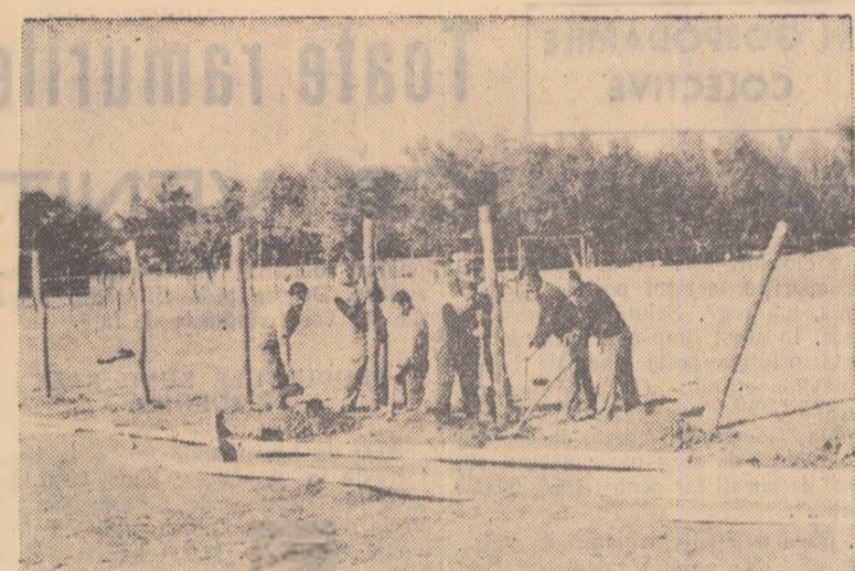
Se amenajează un teren de sport în comuna Brezoaia, raionul Râcari

Cercurile conducătoare din Uniunea Sovietică — se subliniază în declarația agenției TASS — își exprimă convingerea să șefii de guverne vor găsi o soluționare justă și rațională a problemei reglementării pașnice cu Germania, adică a încheierii Tratatului de pace cu Germania, pentru a lichida rămășițele războiului trecut. Acest lucru va da posibilitate statelor care au participat la războiul împotriva Germaniei hitleriste să semneze Tratatul de pace și în Europa centrală vor fi în sfârșit instaurate între state relații normale pentru timp de pace. In felul acesta va fi lichidat și focarul de încordare din Berlinul occidental, care poate da naștere la tot felul de surprize și poate avea consecințe nefaste. Trebuie ca acest focar să fie lichidat și să se contribuie la crearea condițiilor pentru coexistența pașnică a statelor și întărirea păcii generale.