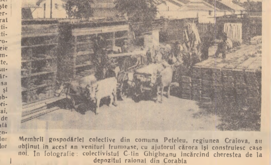
Membru gospodăriei colective din comuna Petelu, regiunea Craiova, au obținut în acest an venituri frumoase, cu ajutorul cărora își construiesc case noi. În fotografie: colectivista C. Ghigheanu încercînd creșterea de la depozitul raional din Corabia.