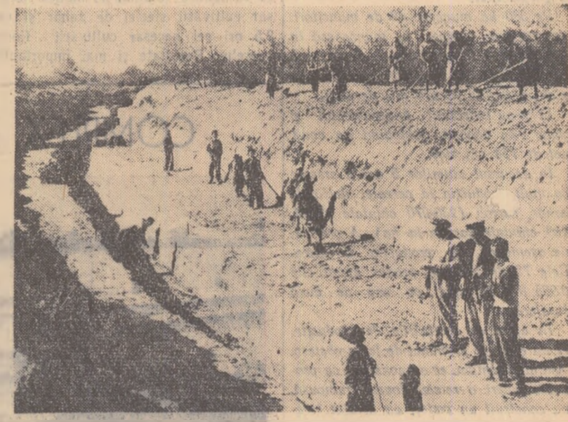
Pe șantierul de îmbunătățiri funciare din comuna Cosimbești, regiunea București, se lucrează de zor la executarea unui dig care va feri de inundații o mare suprafață de teren.