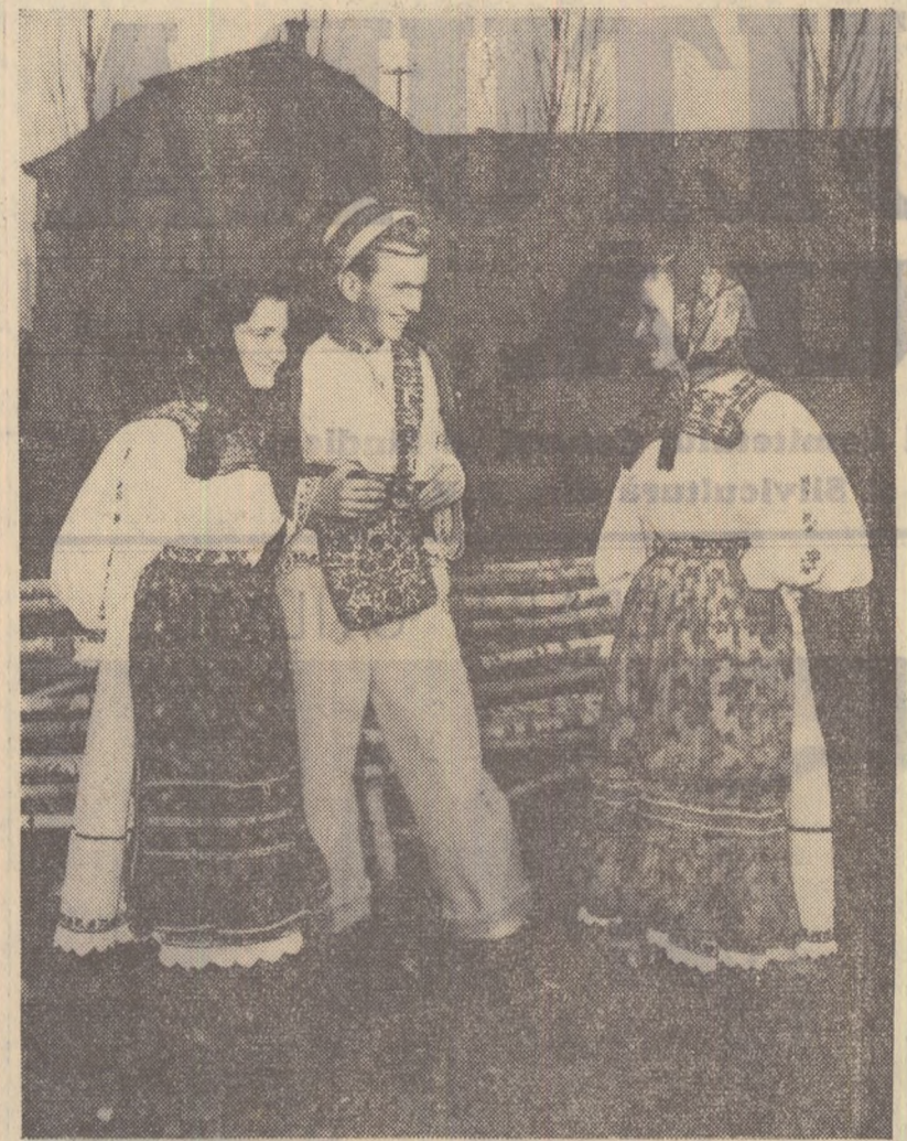
I-ați recunoscut desigur pe tinerii din fotografie. Sînt tineri din Oaș în frumoasele lor costume naționale. Ei au fost surprinși de obiectivul aparatului fotografic chiar în fața căminului cultural construit nu cu mult timp în urmă în comuna lor.