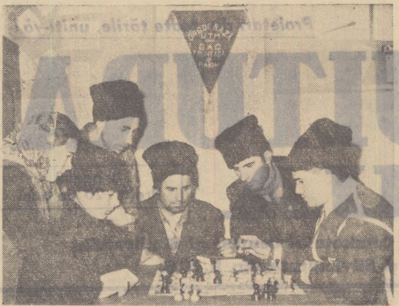
La colțul roșu al gospodăriei agricole colective din comuna Pribești — regiunea Iași — acum în timpul iernii un grup de colectiviști la o partidă de șah.