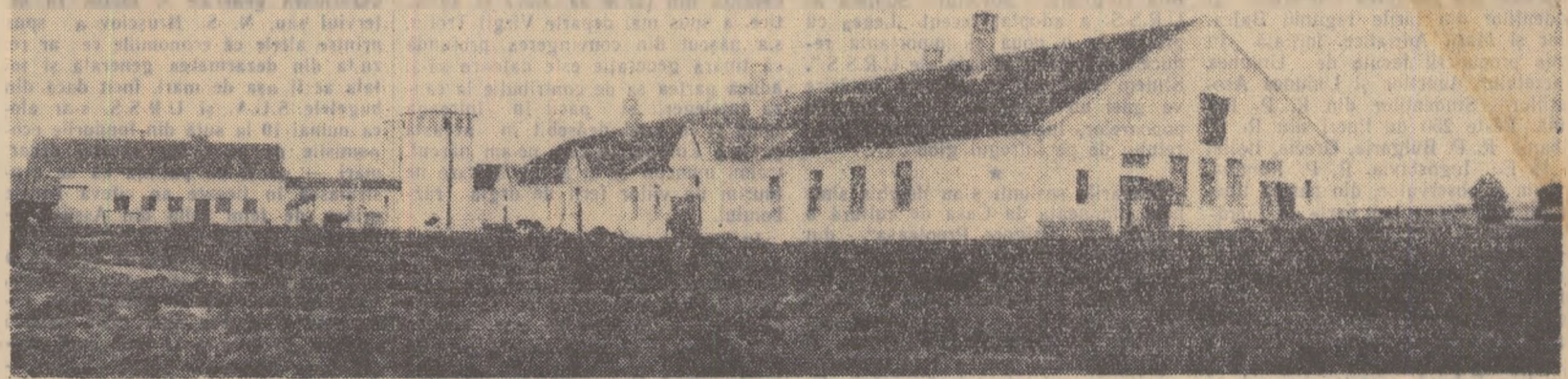
S-a dezvoltat mult în ultimii ani sectorul zootehnic al gospodăriei de stat Urleasca, regiunea Galați. În fotografie: o parte din grajduri și silozurile pentru furaje.