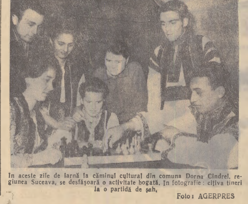
În aceste zile de iarnă la căminul cultural din comuna Dorna Cindrel, regiunea Suceava, se desfășoară o activitate bogată. În fotografie: o țiftă tineri la o partidă de șah.