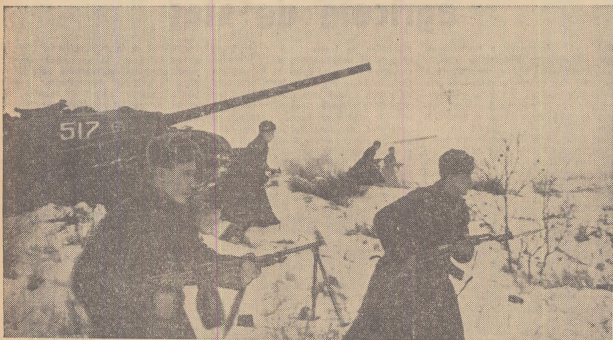
Sub îndrumarea instructorilor bine pregătiți, ostașii sovietici își perfecționează necontenit pregătirea politică și militară. În fotografie: un aspect din timpul unor exerciții tactice.