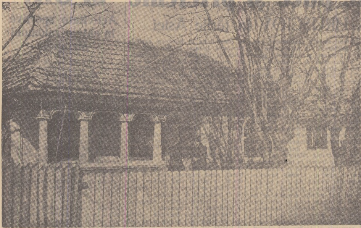
Și în satul Buliga, regiunea Fetești, s-au construit în ultimii ani numeroase case noi. În fotografie: casa cea nouă a colectivității Morolanu Arestide.

8.085.000 de lei beneficii planificate; 24.430.000 de lei beneficii realizate