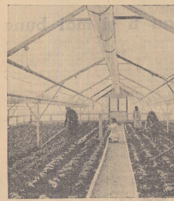
La Institutul de cercetări hortivivicole din București, se experimentează diferite tipuri de sere construite din material plastic. În fotografie: o astfel de sară în care se cultivă roșii.

Aproape în toate regiunile țării există condiții naturale favorabile pentru cultura fasolei, ea avînd aceiași arie de răspîndire ca și porumbul.