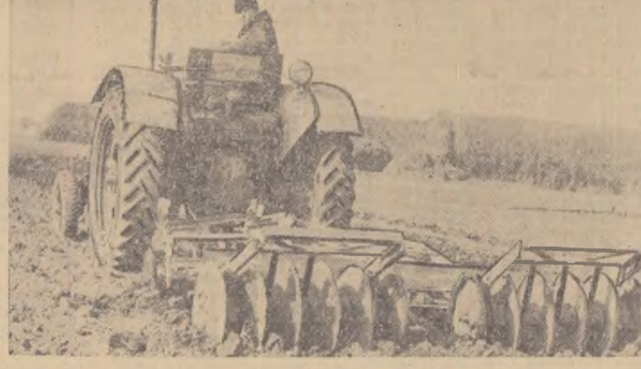
La gospodăria de stat Andrașești, regiunea București, mecanizatorii pregătesc cu sirguții terenurile care urmează a fi însemîntate în curînd.

cît mai sporite, membrii gospodării agricole colective „Lampa lui Ilici” din comuna Ovidiu, regiunea Constanța, au transportat pînă de curînd peste 900 tone de gunoi de grajd.