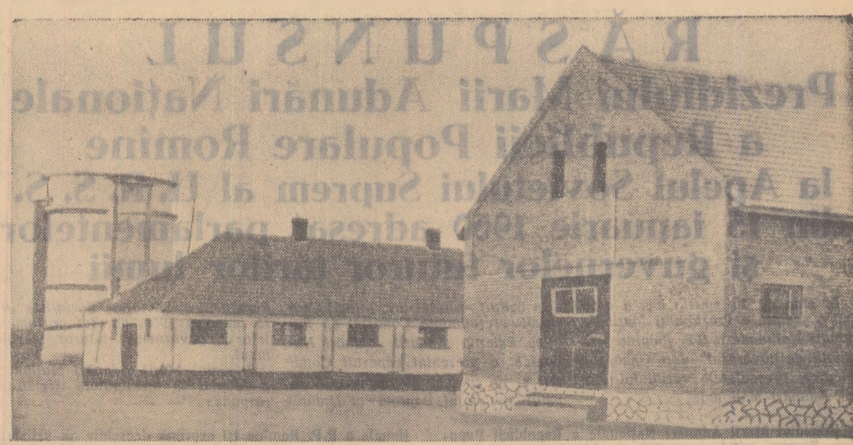
Anul trecut colecțiștii din Sîntana, regiunea Oradea, au ridicat noi construcții zootehnice. În fotografie: aspect al complexului zootehnic.

• Gospodăria colectivă din Curtici, raionul Arad, numără, acum, 2.450 de familii cu o suprafață de peste 6.500 ha de teren.