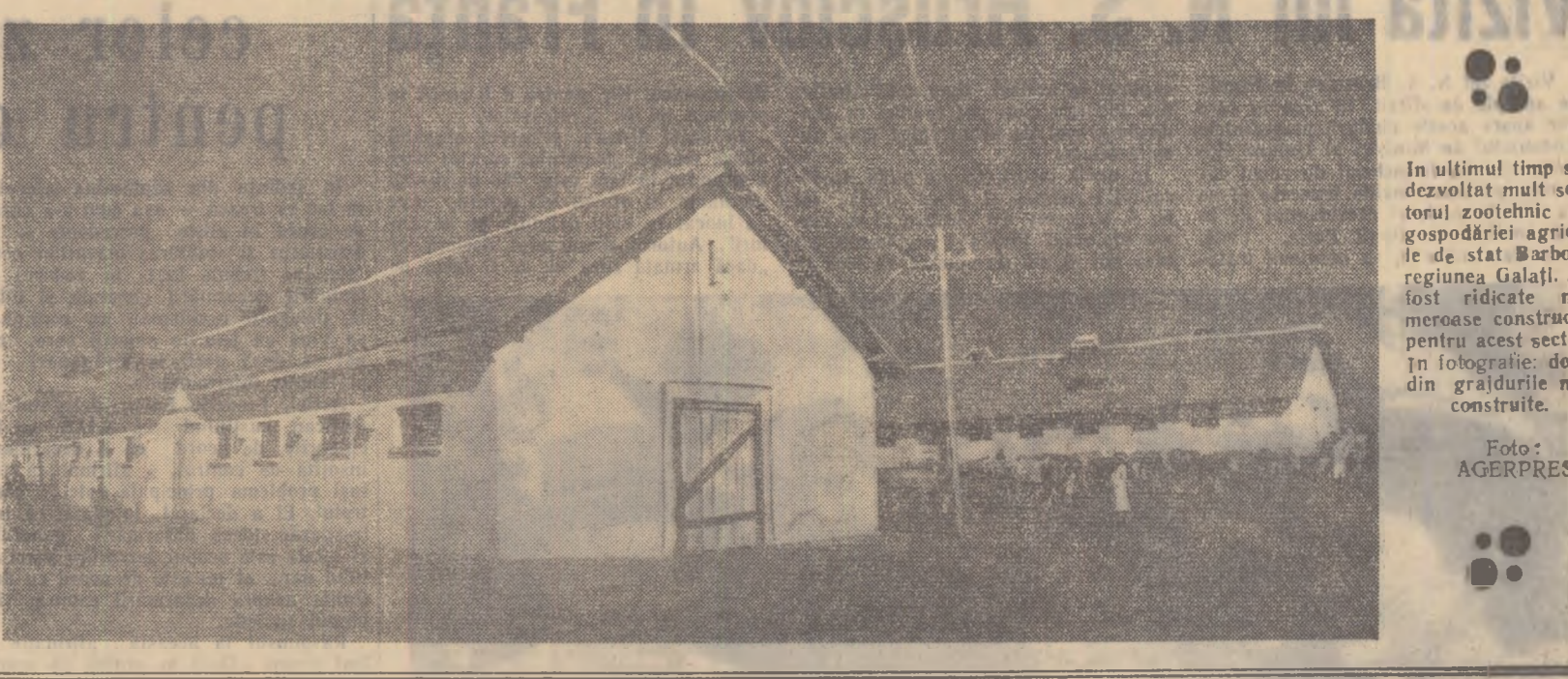
In ultimul timp s-a dezvoltat mult sectorul zootehnic al gospodăriei agricole de stat Barboși, regiunea Galați. Au fost ridicate numeroase construcții pentru acest sector. În fotografie: două din grădiniile nou construite.