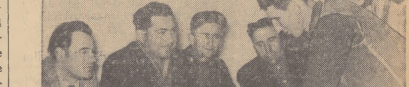
Pe inserate, la sediul gospodăriei colective se adunaseră oameni mulți. Despre ce era vorba? Cîțiva țărani întovărășii aduseră cereri de înscriere în gospodăria colectivă (foto nr. 4).