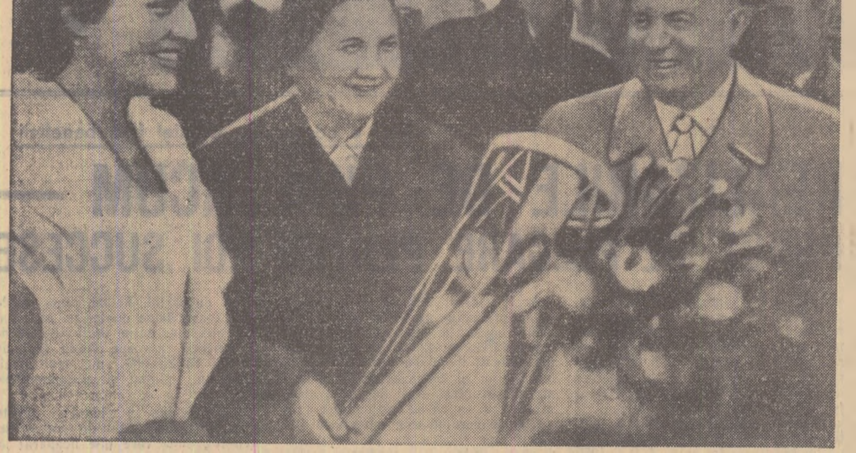
Locuitorii din Arles oferă flori lui N. S. Hrușciiov

de canonicul Kir, pentru a fi rostit în prezența lui N. S. Hrușciiov. În acest discurs, primarul orașului aduce omagii „poporului curajos care a triumfat în fața celor 265 de divizii germane” în orașul Stalingrad, care „a blocat în mod definitiv pe năvălitorii”. Autorul discursului declară că „dacă armata rusă nu ar fi făcut pe