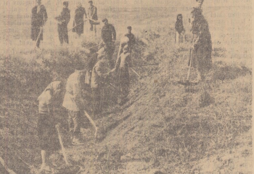
Una din lucrările de primăvară pe care le execută în prezent muncitorii de la gospodăria agricolă de stat Cerna Vodă este și curățirea canalelor de irigație.

Pe întreaga suprafață de 1.750 de ha. care va fi însemnată cu porumb în primăvara aceasta, au fost administrate îngrășămintele naturale și chimice cu ajutorul tractoarelor și tractoarelor agricole. În primăvara aceasta, au fost administrate îngrășămintele naturale și chimice cu ajutorul tractoarelor și tractoarelor agricole.