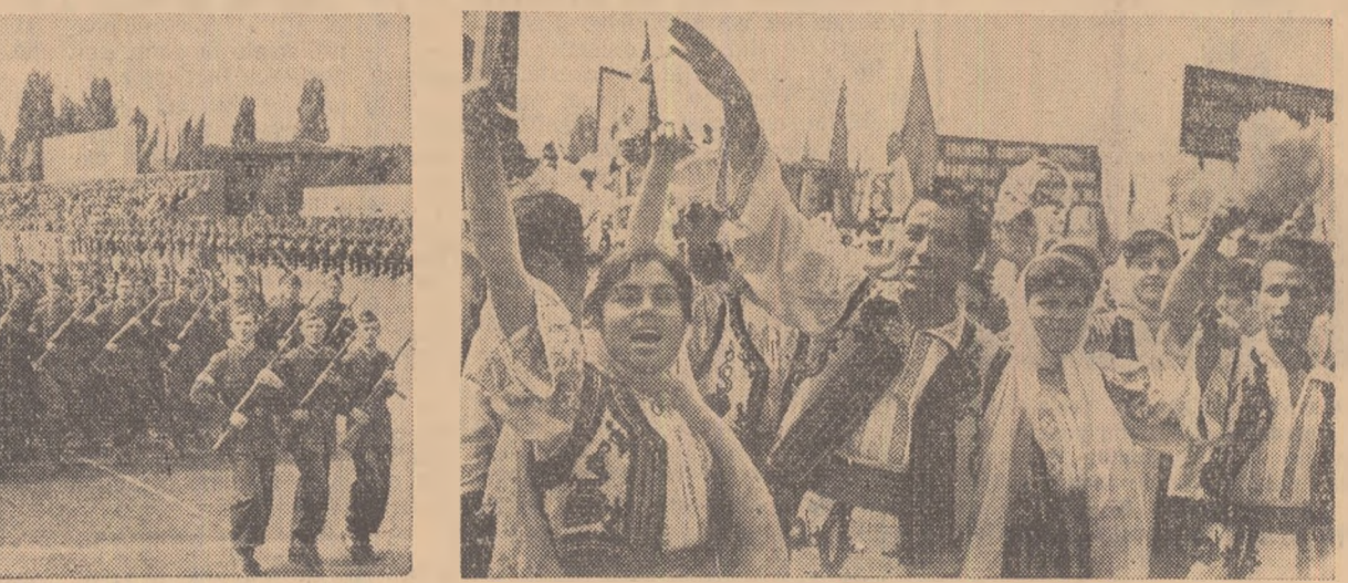
Et salută din adîncuri înimă pe conda celorlalt partidului și guvernului

O Inscriptie masivă: „Trăiască 1 Mai” anunță începutul demonstrației oamenilor muncii. Urmează apoi o mare unduire de steaguri purpurii și tricolore, și în fața tribunelor pășesc primele coloane ale oamenilor muncii din București. Cu brațele încercate de flori, cu eșarfe, stegulețe și baloane multicolore, asemenea unui suvoi viu, uriaș, cocolorat, trec zeci de mii de demonstrații, pînă de veselie, de optimism. La tradiționala lor sărbătoare, oamenii muncii din Capitală țării își manifestă bucuria pentru marile succese obținute de poporul romin pe drumul victorios al socialismului, pentru remarcabilele succese ale Uniunii Sovietice dobîndite în construcția desăsurată a comunismului, pentru realizările însemnate obținute de popoare-