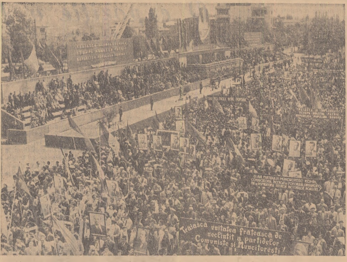
Manifestîndu-și dragostea și atașamentul față de partid și guvern, oamenii muncii din București trec prin fața tribunei în șuoi neîntrerup.

buanelor peste 5.000 de muncitori înarmați. Asistența s-a ridicat în picioare, răsplătindu-i cu aplauze puternice, îndelungate. La tradiționala lor sărbătoare, cel