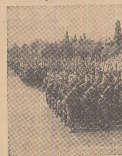
În pas cadențat, trec gărziile muncii reșii