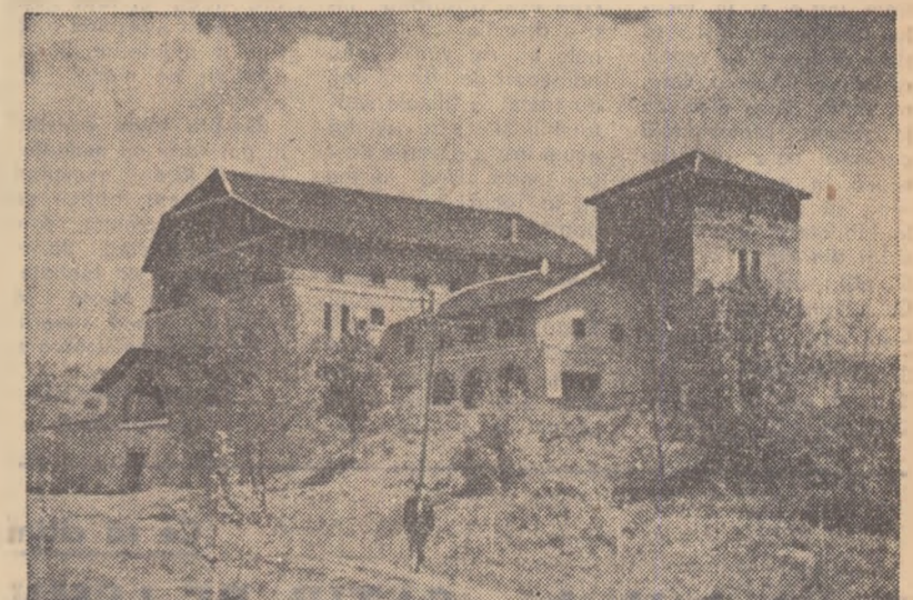
Gospodăria de stat din Tirol, raionul Gătales, regiunea Timișoara, are un sector viticol bine dezvoltat, iar vinurile produse aici au calități deosebite pentru păstrare și învechire. În fotografie: vedeți „uzina” de vinificare a gospodăriei, o construcție modernă, bine utilată, cu o capacitate de depozitare de 100 de vagoane.