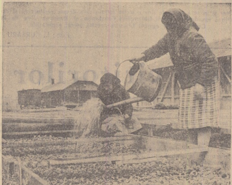
La gospodăria colectivă din Gorneni, regiunea București, au fost dezvoltate anul acesta în mare măsură culturile forțate în răsadnițe.