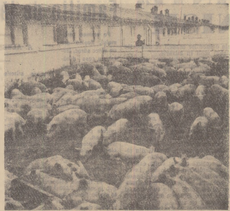
La gospodăria de stat Dilga, regiunea București, se crește anul acesta un mare număr de porci, lăta o parte din porcii scoși într-unul din padocuri.