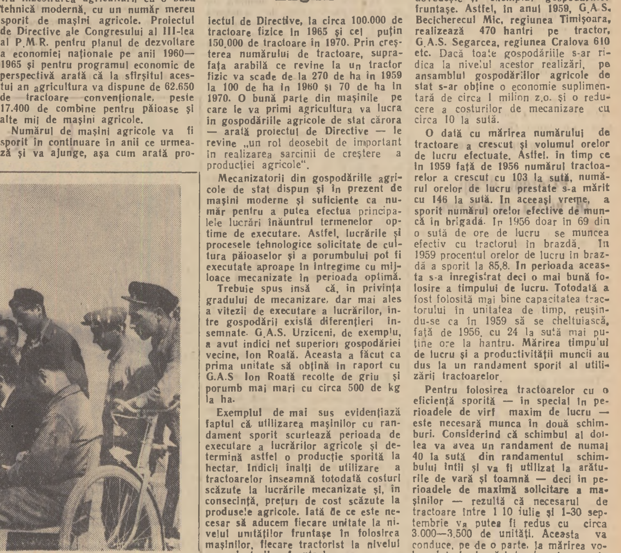
Membrii unei din grupele sindicale de la S.M.T. Titu, ascultînd lectura Proiectului de Directive ale celui de al III-lea Congres al P.M.R.

„Îndată ce au primit zărele în care a fost publicat Proiectul de Directive ale Congresului al III-lea al Partidului, întovășirile din organizația de partid a S.M.T.-ului Titu, regiunea București, în colaborare cu comitetul sindicatului au luat măsura ca la sfârșitul orelor de lucru să se organizeze adunări pe grupe și sindacate, în cadrul cărora să fie citit proiectul.”