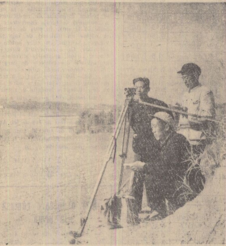
Tăranii din provincia Tensi depun o muncă susținută pentru efectuarea unor vaste lucrări de irigație, în urma cărora vor fi valorificate 134.000 hectare de noi terenuri agricole.