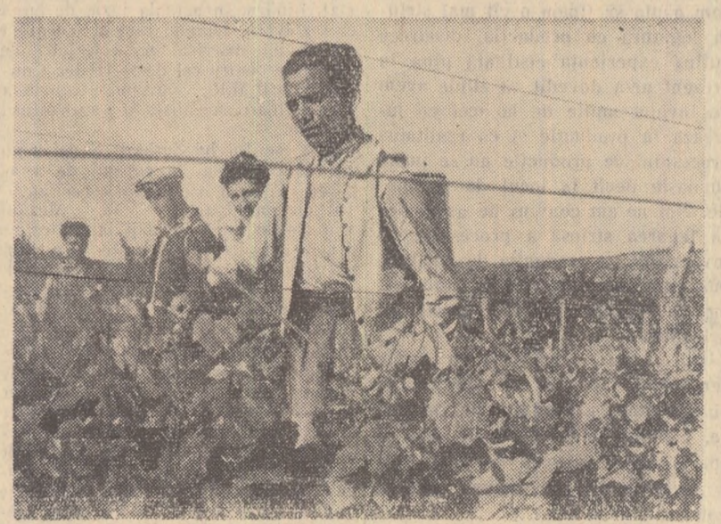
Ville gospodăriei de stat Bucium, regiunea Iași, promit în acest an o recoltă deosebit de bună. Pentru a feri via de atacul manel, muncitorii au început de cîteva zile stropirile cu zeamă bordeleze. În fotografie: omenii din brigada I-a de secția Petriș, la stropit.