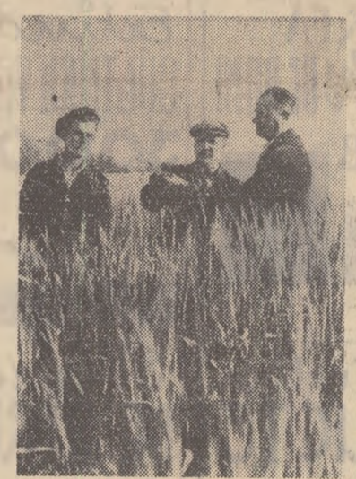
Colectiviștii din comuna Munteni, raionul Tecuci, au însășișinat anul acesta 600 de ha cu grâu, care promite o producție sporită. În fotografie: președintele gospodăriei împreună cu inginerul și secretarul organizației de partid din gospodărie, controlează stădiul în care se află cultura de grâu.