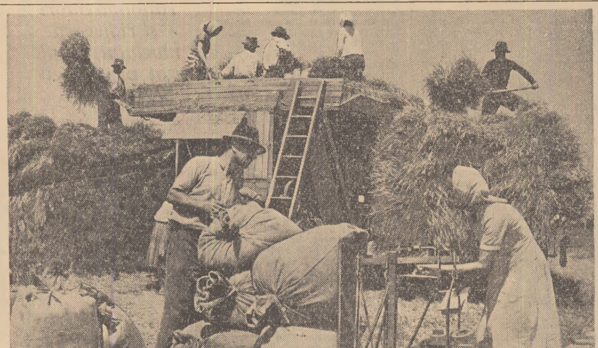
La aria colectivității din comuna Brănești regiunea București se treieră din plin. Producția este bună. Peste 2.200 kg. de grâu la hectar.