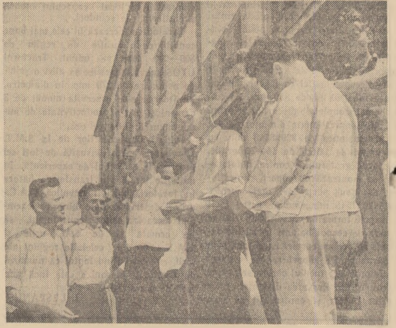
Un grup de delegați la Conferință în timpul unei pauze.

Îndrumați în mod permanent de ingineri și tehnicieni și antrenati în muncă de comitetul sindicatului, sub conducerea organizației de partid, mulțitorii noștri aplică metode înaintate de îngrijire și creștere de vaci.