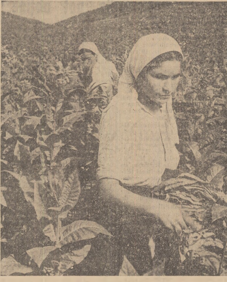
Recoltatul tutunului pe ogoarele cooperativei agricole de muncă „Viața Nouă”.