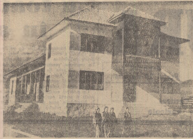
De curînd în comuna Casna, regiunea Suceava, a fost dat în folosință un frumos cămin cultural construit prin muncă voluntară și contribuția bănească a cetățenilor.

Adunarea festivă din Brănești s-a încheiat cu un frumos program artistic prezentat de formațiile căminului cultural din localitate.