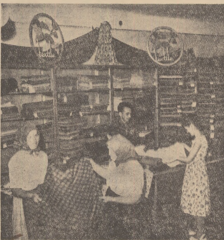
Noul magazin universal al cooperativei din comuna Sandra, regiunea Timișoara, este bine aprovizionat cu tot felul de mărfuri industriale. În fotografie: aspect din raionul pentru vînzarea textilelor.

Problema sporirii materialului săditor la hectar și asigurării unei calități superioare constituie, de asemenea o preocupare a cercetătorilor stațiunii. Ei au obținut rezultate bune atît în ceea ce privește surtarea procesului de producere a materialului săditor pomicol, cit și în stabilirea celor mai buni portanți pentru diferite specii și soiuri de pomi cultivați în diferite condiții pedoclimatice.