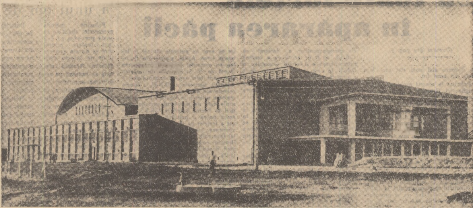
În această toamnă gospodăria agricolă de stat Tohani, raionul Mizil, a intrat în funcțiune o uzină vincolă în capacitate de 400 de vagoane. În fotografie: exteriorul acestei uzine.

● În anul trecut, datorită lipsurilor în organizarea muncii, în aplicarea agrotehnicii, precum și lipsei de stabilitate a cadrelor, sectorul legumicol al G.A.S. Salonta își încheia activitatea cu pierderi. Nu mai departe decît în 1959, de pîldă, pierderile au fost de 317.000 lei, producția de roși fiind de numai 12.700 de kg, la ha. În plus roșiile au