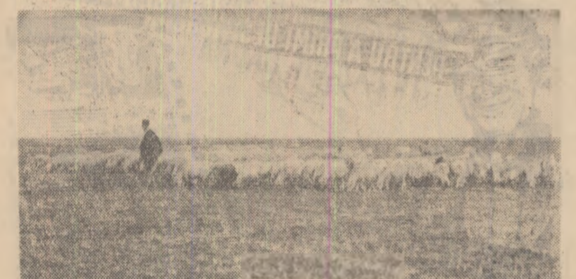
O parte din cele 1.800 de oi ale gospodăriei agricole colective din Baba Ana, raionul Mizil.