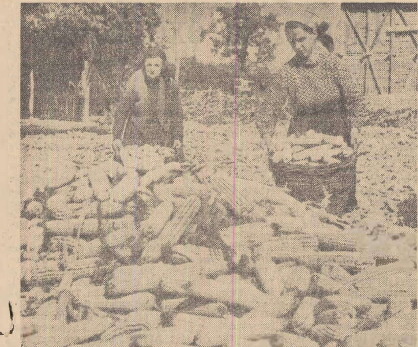
Gospodăria agricolă colectivă „Calea Belșugului” din comuna Cimplăneanca, raionul Focșani, a cultivat în acest an 400 hectare cu porumb, obținând peste 3.300 kg ștuleți la hectar.