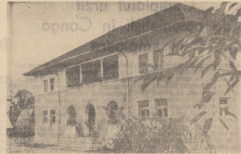
Stațiunea experimentală pomicolă I.C.H.V. din Volnești, raionul Tirgoviște, este îndeajuns de cunoscută prin realizările frumoase obținute în cei 10 ani de existență. Noul sediu pe care l-au primit spre folosință, nu de mult, cercetătorii științifici, și pe care îl vedeți în această fotografie, corespunde intrutotul nevoilor lor de cercetare.

Și în activitatea de producție a gospodăriilor agricole colective s-au obținut succese importante. Astfel, la cultura grîului pe întreaga suprafață