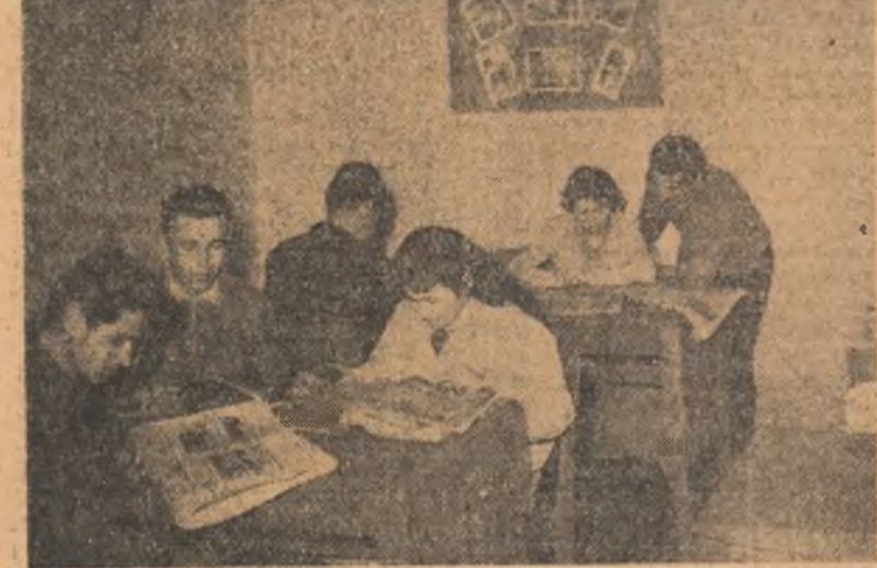
În fiecare seară, la căminul cultural din comuna Cenad — regiunea Banat, numeroși tineri vin să citească cărți, ziare și alte publicații. În fotografie: un aspect din sala de lectură.