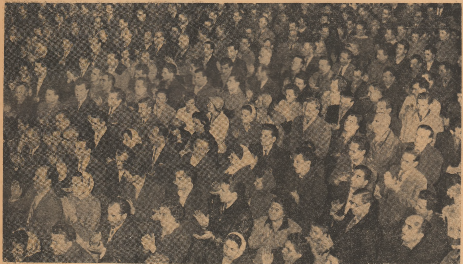
Marți, în sala cantinei Atelierelelor C.F.R. „Grivița Roșie“