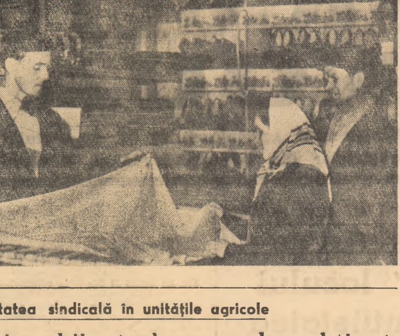
Din activitatea sindicală în unitățile agricole