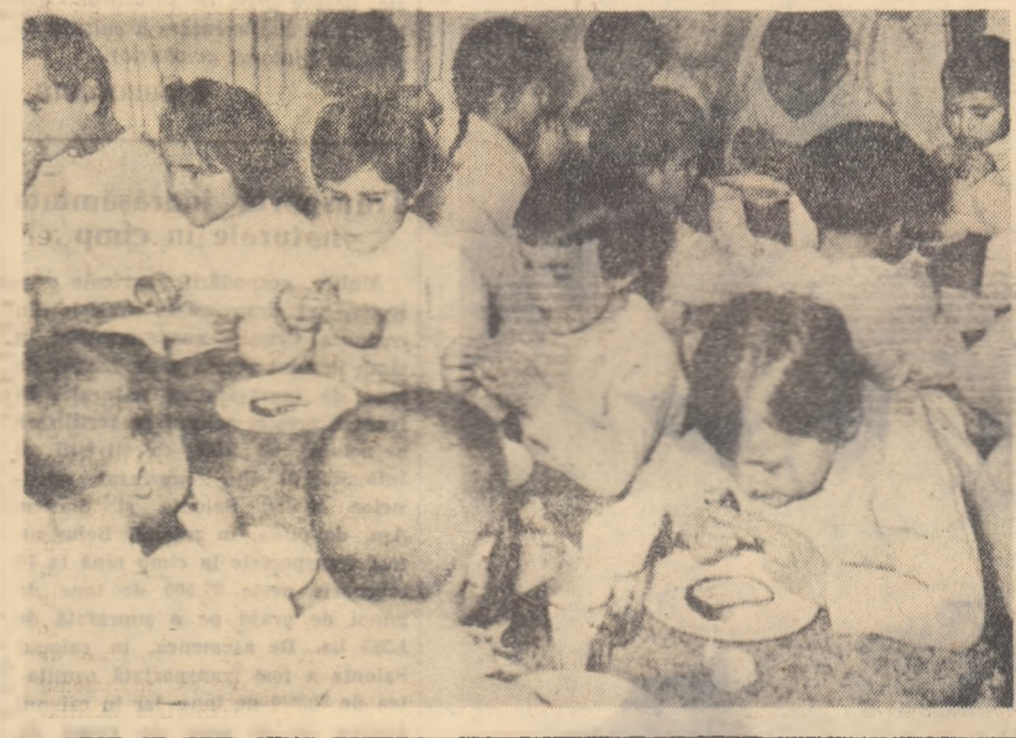
E ora mesei de prînz. La cîmînul de țor copii muncitorilor de la gospodăria de stat din Căzănești, regiunea București, primesc un meniu bogat și bine pregătit. Apoi se vor odihni și deșigur că după orele de somn joaca va fi și mai plăcută.