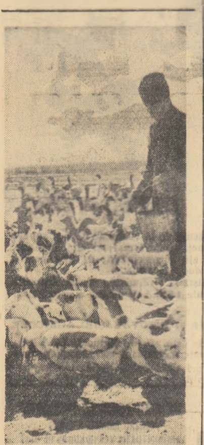
Membrii gospodăriei agricole colective din Ceacu, regiunea București, au dezvoltat în ultima vreme și ferma de păsări. În fotografie: un îngrijitor dînd gîștelor rația de dimineață.

Intrucît baza producției piscicole în gospodăriile de stat o constituie creșterea intensivă a crapului de cultură