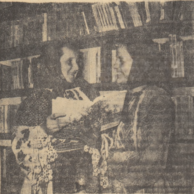
Au sosit noi cărți la biblioteca cîmînului cultural din comuna Curtea, regiunea Banat.