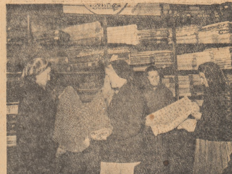
În noul magazin de textile al cooperativei din comuna Șemlac — raionul Arad.

În acest fel zona de lucru s-a mărit de la 16.000 ha la circa 21.000 ha arabile mecanizabile. Faptul acesta implică modificarea planului de dotare a S.M.T.-ului Ianca, unitate care ar trebui să mai fie înzestrată încă în cursul acestui trimestru cu cel puțin 35 de tractoare peste planul inițial. Scopim că serviciul regional S.M.T. Galați a luat în acest scop măsurile necesare.