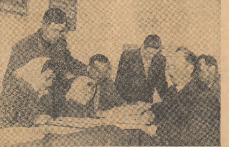
La Casa alegătorului din comuna Episcopia, regiunea Crisana, numeroși alegători vin zilnic pentru a verifica listele de alegători întocmite din vreme.

poată realiza venituri cit mai mari la ziua-muncă. La întâlnirea cu candidatul lor, alegătorii și-au luat angajamentul să contribuie din plin la terminarea completă a electrificării comunei, să amenajeze prin muncă patriotică trei fîntîni și cele două parcuri, precum și terenul de sport din comună. Unii dintre ei au propus, printre altele, să se înceapă construirea unui canal pentru desecarea unei bălți. Discuții rodnice, propuneri chibzuite, hotărîri de a traduce în viață tot ce este în folosul oamenilor — iată ce a caracterizat întâlnirea alegătorilor din circumscripția electorală raională nr. 7 cu candidatul lor în alegerile de la 5 martie. GH. ION