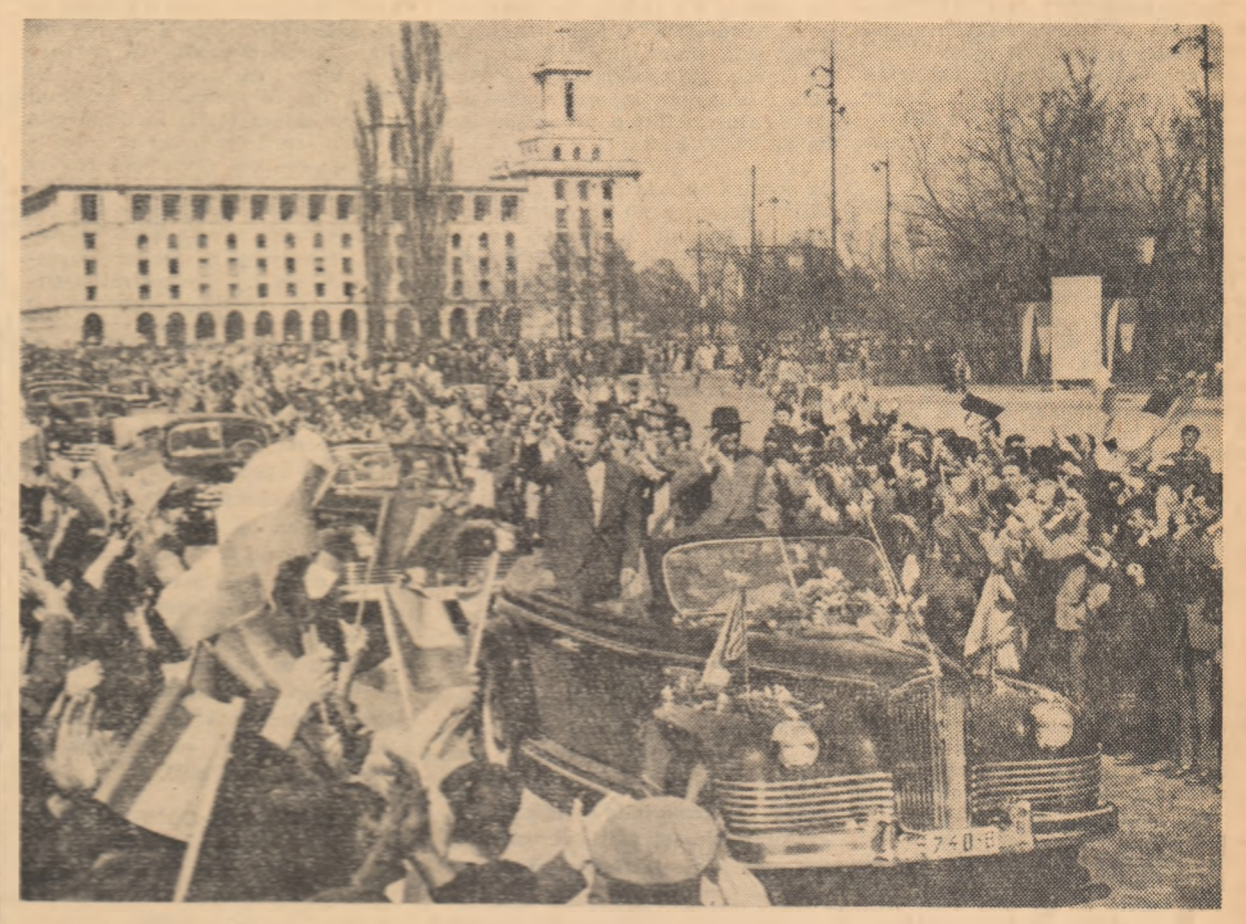
De-înنگul întregului oraș, populația Capitalei acamă pe tovarășii Gheorghe Gheorghiu-Dej și Antonin Novotny

Miercuri la amiază a sosit în Capitală delegația de partid și guvernamentală a P. S. Cehoslovace care face o vizită de prietenie în țara noastră la invitația Comitetului Central al Partidului Muncitoresc Român, Consiliului de Stat și guvernului R. P. Romîne.