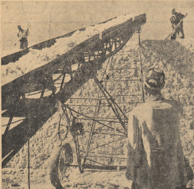
La fabrica de egrenat bumbac a colhozului „Gorki” din Tadjikistan