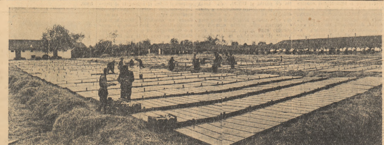
Gospodăria agricolă colectivă din comuna Bors, regiunea Crișana, a cultivat anul acesta legume forajate în răsadnă caldă pe o suprafață de 3.000 m.p. În fotografie: Un aspect de la recoltarea castraveților. Pînă acum cîteva zile au și fost livrate 5.000 de kg. castraveți.