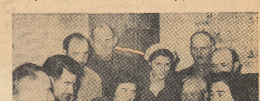
Ca peste tot în țara noastră, și la gospodăria agricolă colectivă Otopeni zărele au fost așteptate și citite cu cel mai mare interes.

Oamenii muncii au aflat cu o încredere și entuziasm, conștințit raportul prezentat de tovarșii Gheorghe Gheorghiu-Dej la adunarea festivă organizată cu prilejul aniversării a 40 de ani de la crearea Partidului Comunist din România. Document de importanță istorică pentru dezvoltarea mișcării muncitorești din țara noastră, Raportul vorbește despre drumul glorios de luptă al partidului nostru în slujba poporului, despre victoriile obținute de masele populare conduse timp de 40 de ani de încercatul cîrmaci spre viață liberă și fericită. Oamenii muncii citează cu emulie și recunoștință cuvintele tovarșului Gheorghe Gheorghiu-Dej: „Partidul Intruchipează tot ce e mai bun în poporul nostru, el este inima fierbîntă și conștința poporului, înțelepciunea și voința sa colectivă”.