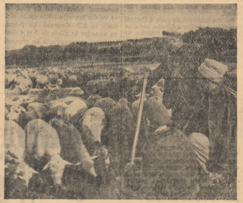
Turma de oi a gospodăriei colective din Topala, regiunea Dobrogea, numără peste 10.000 de capete. În fotografie: o parte din turmă, la pășunat.