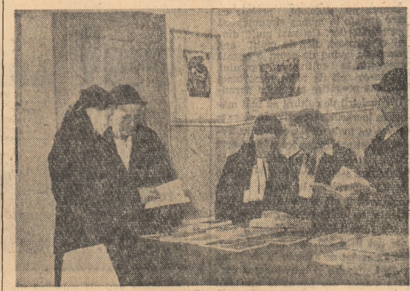
Zilnic, la biblioteca cîminului cultural din comuna Rășinari, regiunea Brașov, vin numeroși tineri și vîrstnici pentru a consulta și împrumuta cărți literare și agrotehnice, așa cum se vede în fotografie.