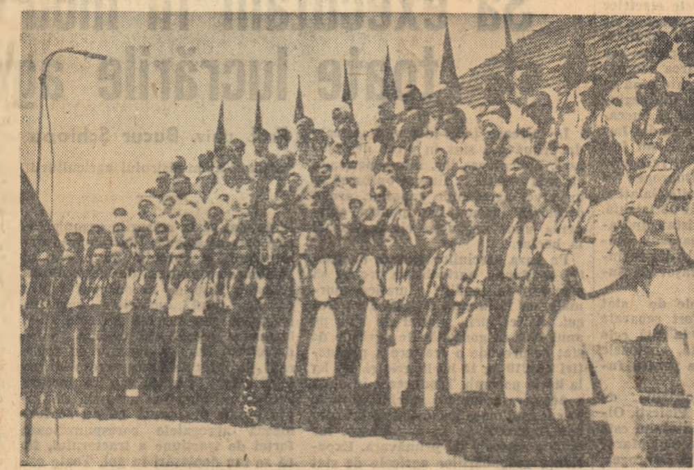
Corul cîminului cultural din comuna Poiana, regiunea Hunedoara, pe care-l vedeți în fotografie, și-a cântat o frumoasă reputație, datorită atât repertoriului folosit, cât și măiestriei cu care interpretează cîntecele.