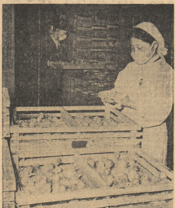
La ferma agricolă Kwangpo, regiunea Jungpyung, provincia Hamghenul de Sud, sînt crescute mil de rațe. În comparație cu anul trecut, în acest an numărul rațelor a crescut cu 8 la sută.