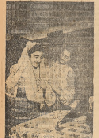
Tinere țărâni — artiști amatori din comuna Lerești, regiunea Argeș, pregătindu-se înainte de a intra în scenă.